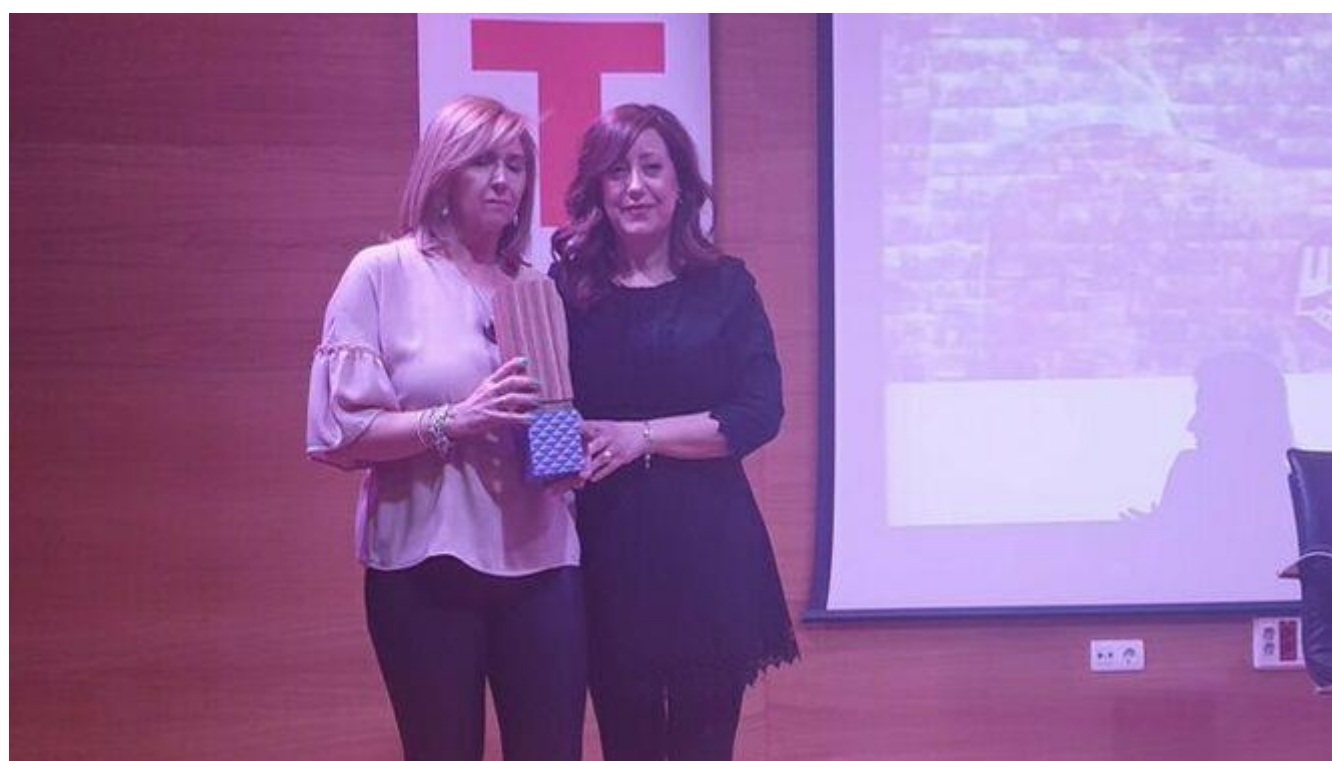
Los premios Luchadoras de UGT reivindican el papel de las mujeres

Se ha reconocido el valor de cuatro mujeres delegadas de la organización, que se han distinguido por su defensa de la igualdad