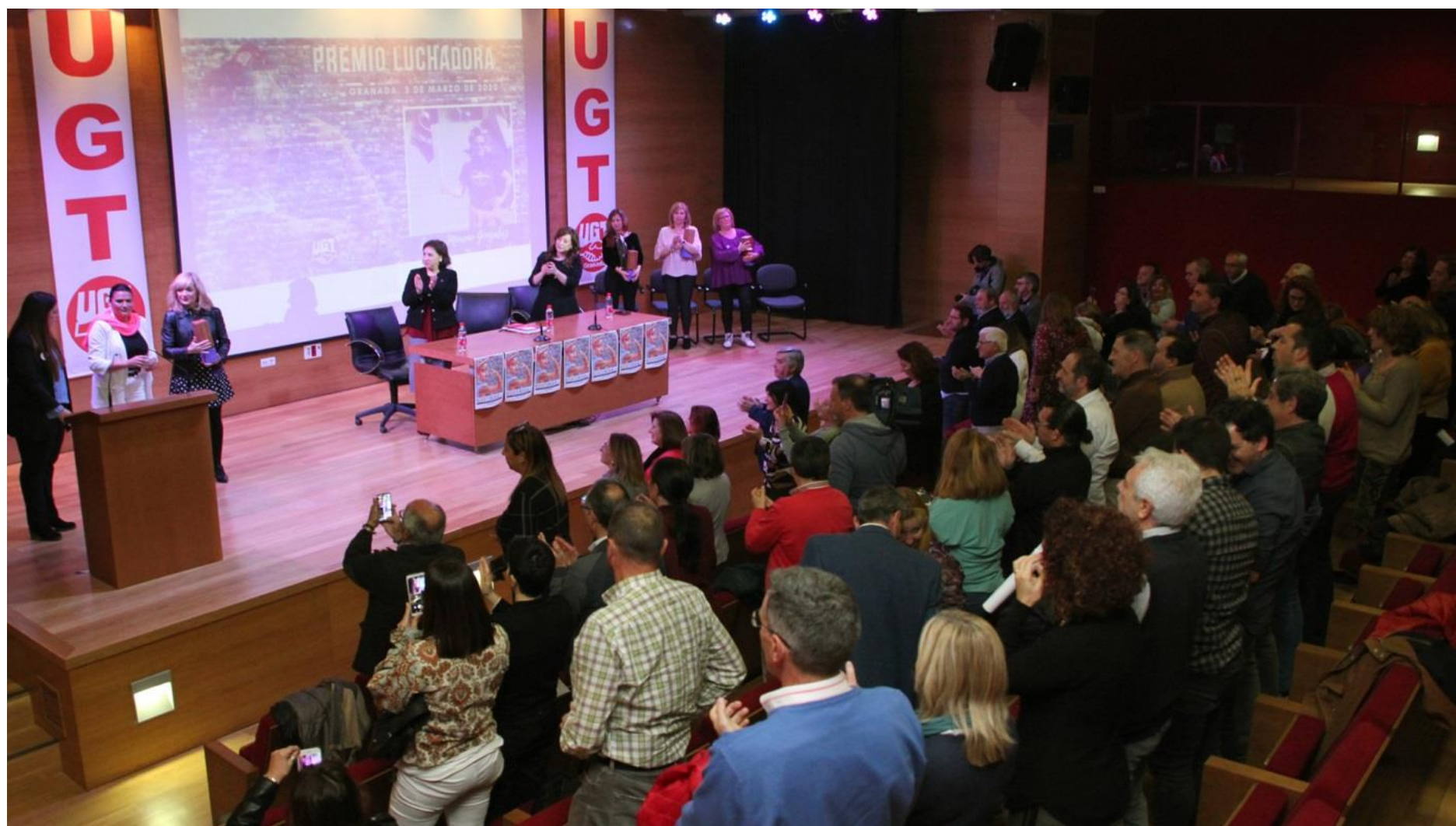
Los premios Luchadoras de UGT reivindican el papel de las mujeres.

"Hoy en día, vive en Sevilla y sigue luchando cada día por seguir adelante y por las especiales circunstancias que vive su hijo", ha concluido el sindicato.