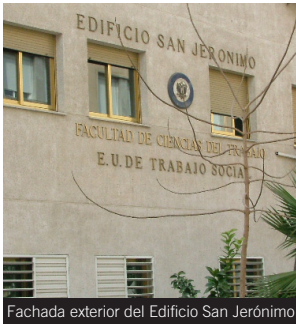
Fachada exterior del Edificio San Jerónimo

Líneas: Acceso al Campus Centro: líneas U, 4, 5 y 6.