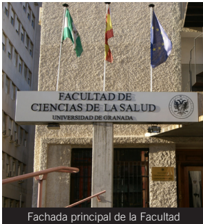
Fachada principal de la Facultad

Líneas: Acceso la Facultad: líneas 1 y 33.