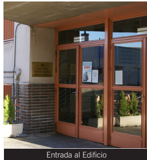
Entrada al Edificio