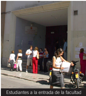
Estudiantes a la entrada de la facultad

Líneas: Acceso al Campus Centro: líneas U, 4, 5 y 6.