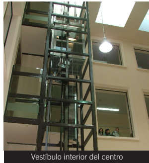
Vestíbulo interior del centro