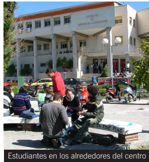
Estudiantes en los alrededores del centro