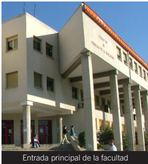
Entrada principal de la facultad

Líneas: Acceso al Campus de Cartuja: C, U y 8.