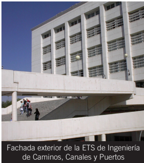
Fachada exterior de la ETS de Ingeniería de Caminos, Canales y Puertos

Líneas: Acceso al Campus de Fuentenueva: líneas U, 5, 10, 11, 21 y 22.