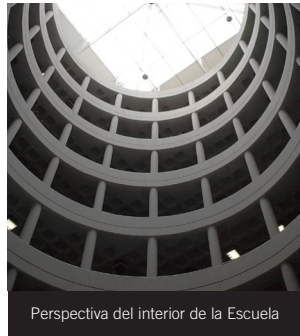
Perspectiva del interior de la Escuela