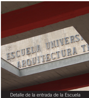
Detalle de la entrada de la Escuela

Líneas: Acceso al Campus de Fuentenueva: líneas U, 5, 10, 11, 21 y 22.