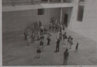
Los participantes disfrutaron de una visita guiada por Vélez Blanco y en Castilla.