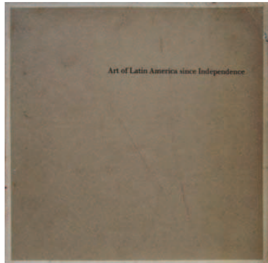
Fig. 5. Catlin, Stanton L. y Grieder, Terence. Art of Latin American since Independence . New York: The Yale University Art Gallery and the University of Texas Art Museum, 1966. Colección MLR

La década de los ochenta se caracteriza por el llamado boom del arte latinoamericano 4 , que se materializa en el número de subastas realizadas en Estados Unidos y en la celebración de importantes exposiciones, donde la figura de Frida Kahlo adquiere un gran protagonismo. A pesar de este boom , se organizan algunas muestras de carácter internacional que contradicen el supuesto interés por lo latinoamericano; es el caso de la celebrada en 1985