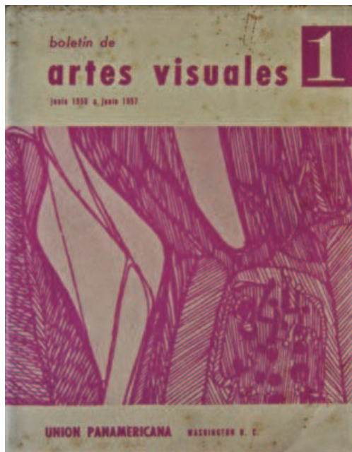
Fig. 4. Boletín de Artes Visuales. Washington: Unión Panamericana, 1956-1957.

de una serie de monografías sobre algunos de los países latinoamericanos, fuentes excepcionales, sobre todo el Boletín , de las exposiciones y otras actividades artísticas realizadas a lo largo y ancho del continente. (Fig. 4).