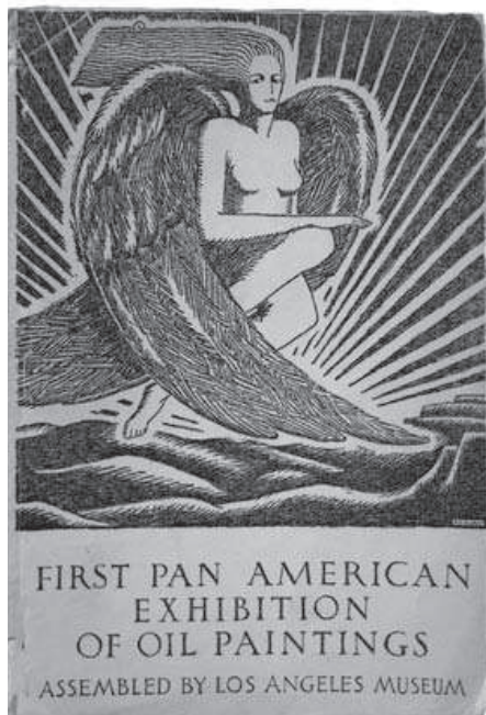
Fig. 1. AA.VV. First Pan American exhibition of oil paintings . Los Ángeles: Los Angeles Museum, 1925. Colección MLR

de avanzada. Buena parte de las obras fue reclutada en los propios países, aunque en varios casos se seleccionaron conjuntos de artistas latinoamericanos residentes en Francia y España. Perú y México fueron los países latinoamericanos más representados, de una manera ecléctica en cuanto a nombres y generaciones, con envíos en los que temáticas indígenas son mayoritarias, mezcladas con otros asuntos. (Fig.1)