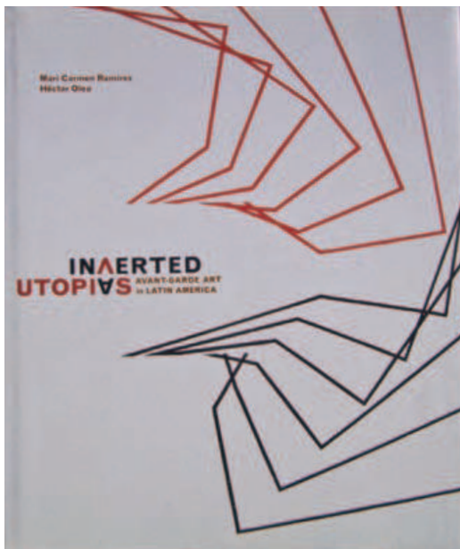
Fig. 8. Ramírez, M a . Carmen y otros. Inverted Utopias: Avant-Garde in Latin America . Nueva York: Yale University Press, 2001. Colección MLR

de Latinoamérica , dentro de la Galería de Arte Archer M. Huntington de dicha entidad, que se convirtió en una de las más completas de su índole en Estados Unidos.