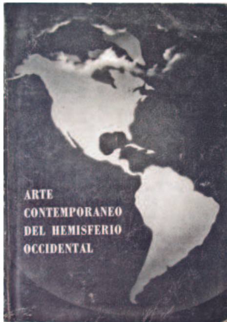
Fig. 3. Arte contemporáneo del Hemisferio Occidental . New York: International Business Machines Corporation, 1941. Colección MLR

El mismo museo adquiriría en 1937 Eco de un grito , de Siqueiros, y El Nuevo Club Atlético de Chicago , del argentino Antonio Berni; al año siguiente, la obra Café , de Portinari. Como puede apreciarse, todos ellos con un transfondo social y/o político (Cockcroft, 1988, p. 192).