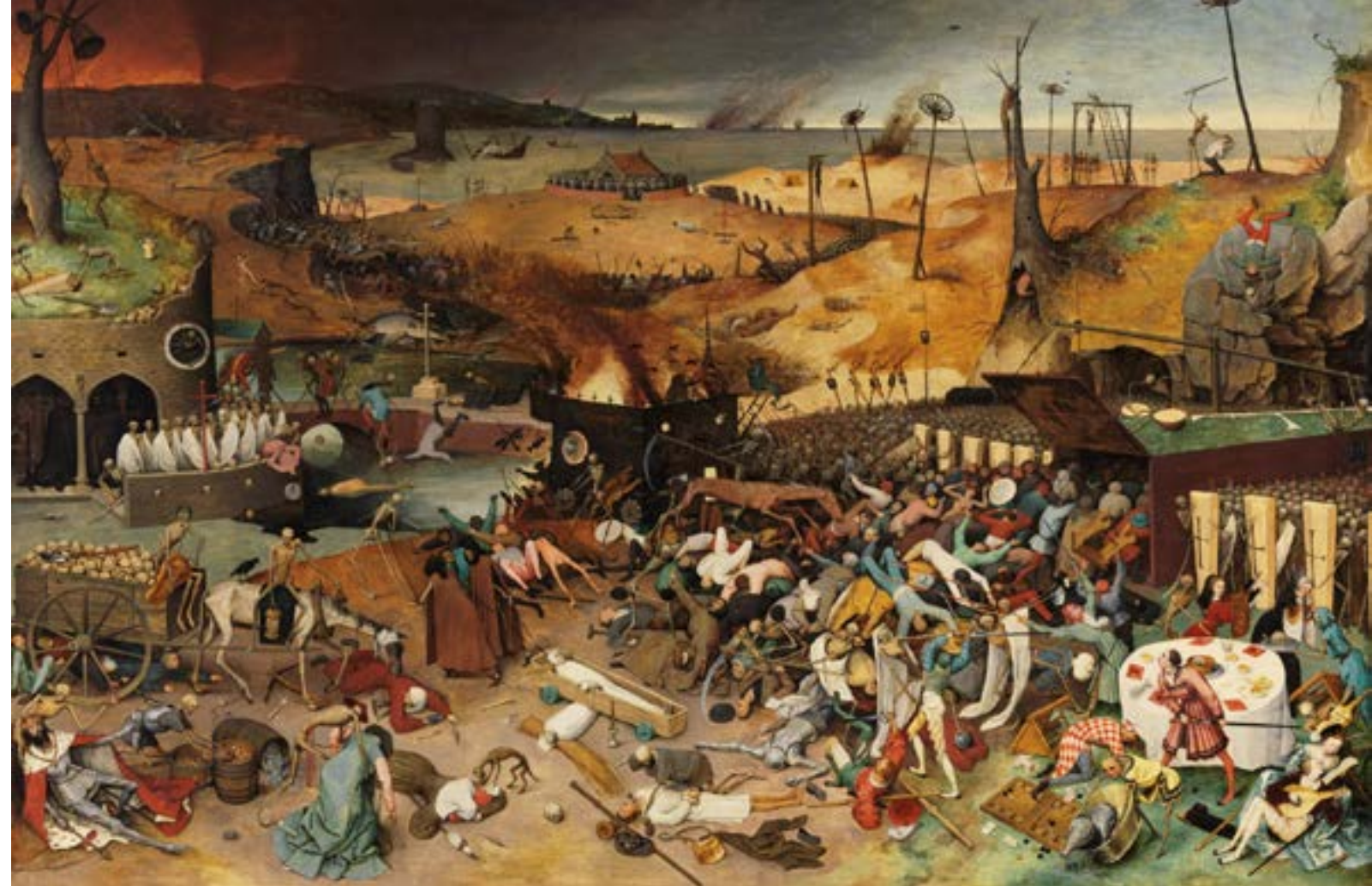
Pieter Brueghel, El triunfo de la muerte

Si bien es cierto que la lepra ha suscitado rituales de exclusión que dieron hasta cierto punto el modelo y como la forma general del