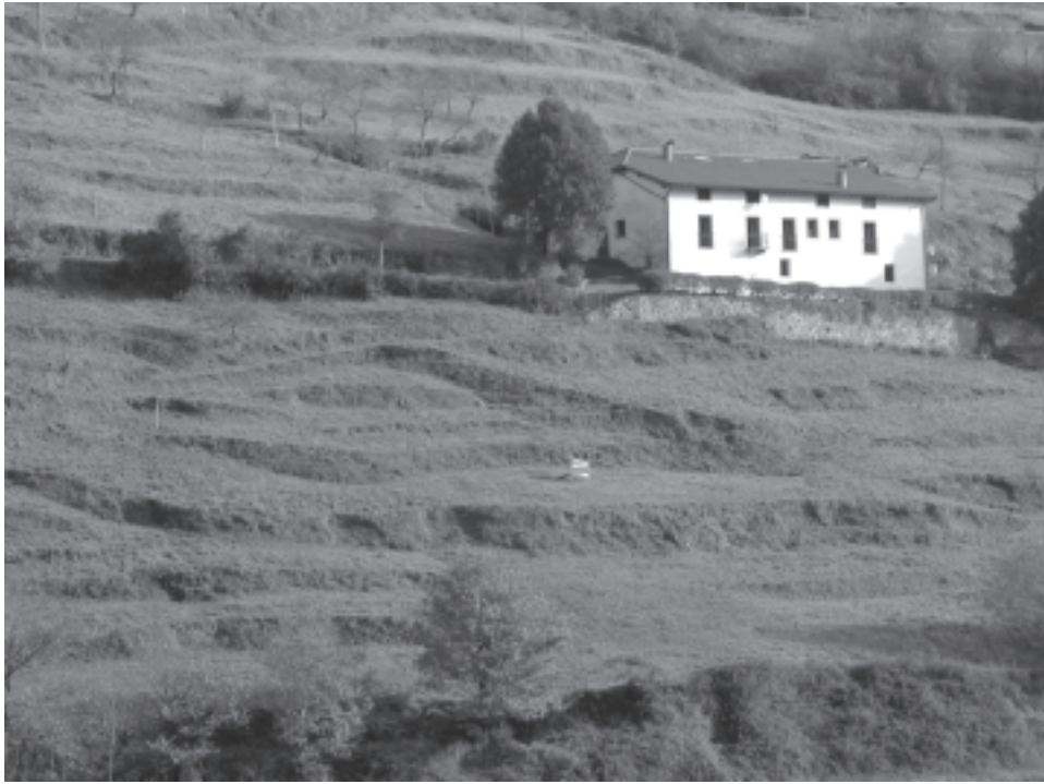
Foto 3. El sistema de acondicionamiento de vertientes mediante «mugas» constituye una de las notas más singulares del paisaje rural vasco-atlántico

texto de Lande. Por último, a todo ello debía unirse la construcción de un nutrido sistema de canales de drenaje, para el cual no sólo era preciso abrir periódicamente surcos superficiales que evacuasen el agua de lluvia sino, sobre todo, crear una red permanente de caños subsuperficiales que, en especial en las zonas cóncavas, las más afectadas por los arrastres, diesen salida a las corrientes generadas por nacimientos difusos, lo que generalmente se hacía construyendo y cubriendo con lajas de piedra metros y metros de canales en forma de V. En las tierras más problemáticas el acondicionamiento debía completarse plantando líneas de arbolado que reforzasen la fijación del terreno. Después, sólo labores de mantenimiento que se sucedían un año tras otro permitían que un espacio conquistado para la agricultura con tanto empeño mantuviese su productividad (UGARTE, F., 1986).