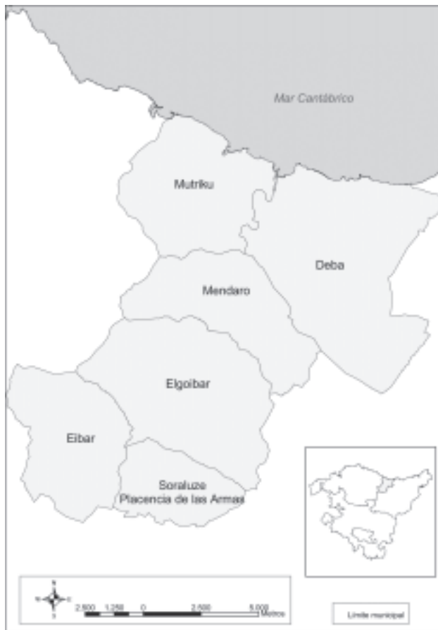
Mapa 1. Comarca de Debabarrena

Elaboración: I. Moro y G. Florido