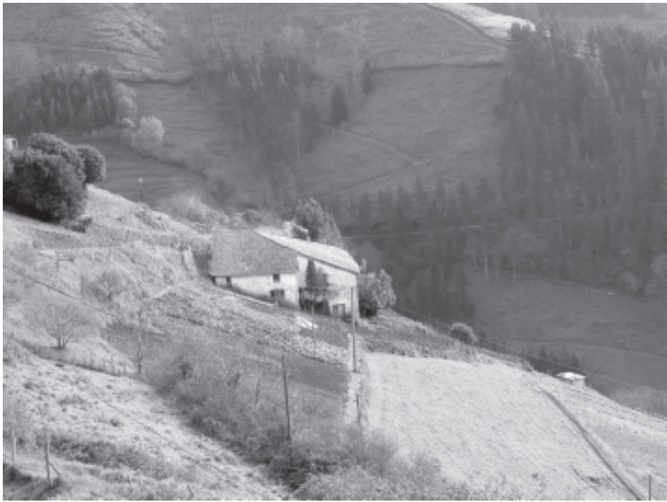
Foto 4. La distribución de usos dentro de las tierras del caserío determina la fisonomía del paisaje rural vasco

la producción), mientras que sólo 7 (lo que supone el 6,14%) acuden a diario a la plaza del mercado o venden sus productos a tiendas del pueblo, sin que la distancia al núcleo urbano parezca ser factor condicionante para la actividad de estos caseríos (puesto que, de hecho, la variabilidad en su localización es muy grande).