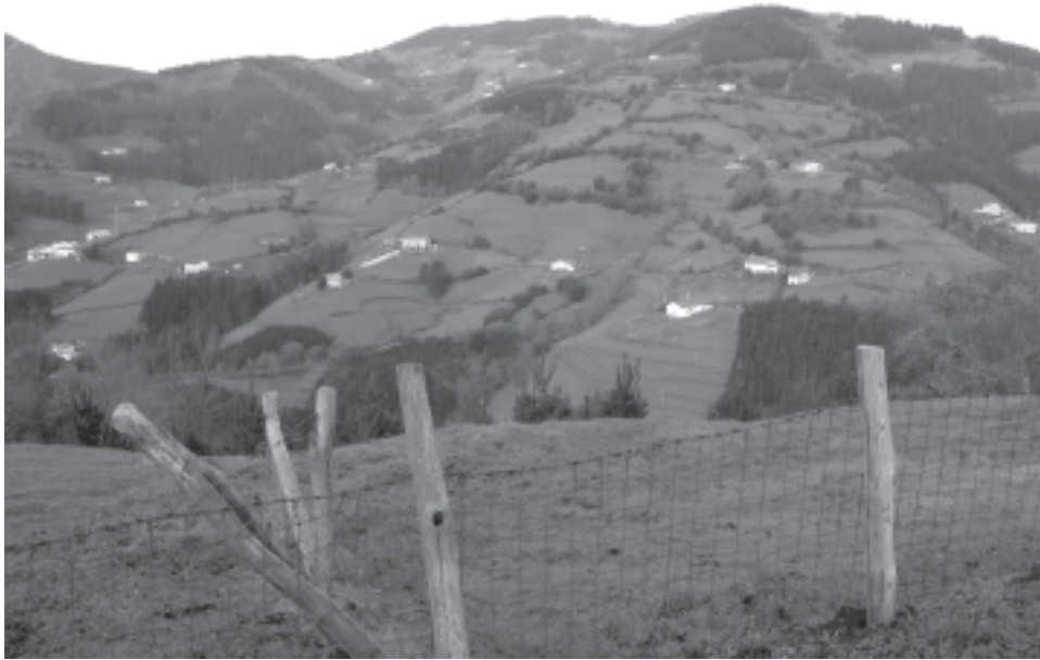
Foto 2. El caserío es una pieza clave en la definición del paisaje agrario

pastos comunales o de enterramiento en la sepultura familiar) reservados en exclusiva a los que viven bajo el techo del caserío.