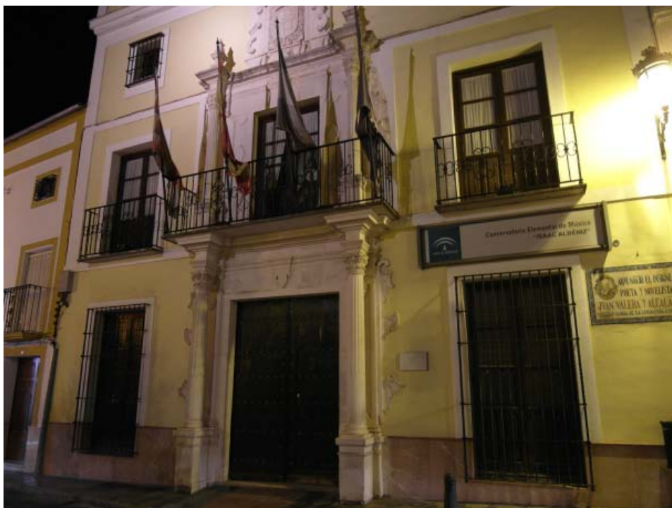
Fig. 1.—Casa natal de Juan Valera en Cabra. (Fotografía de Juan Manuel Barrios Rozúa, 2012).