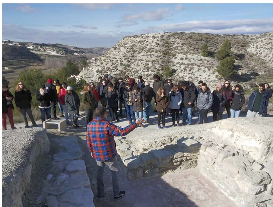
Visita a Galera