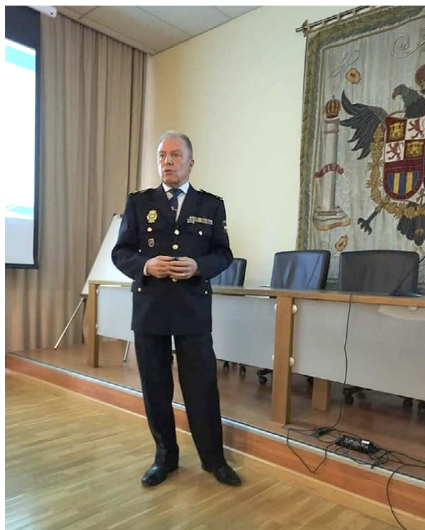
Conferencia del Jefe de la Brigada de Patrimonio de la Policía Nacional