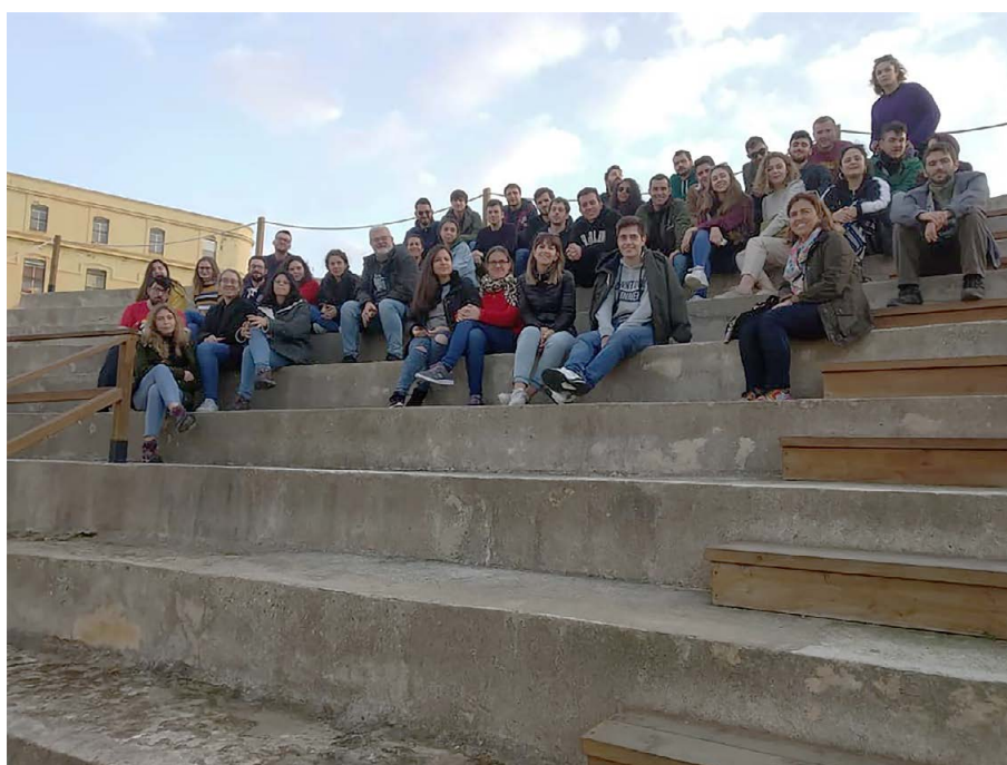
Visita al teatro romano de Cádiz