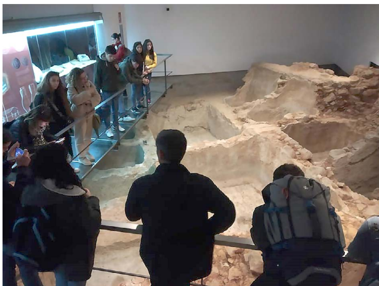
Visita a la factoría de salazones de Cádiz