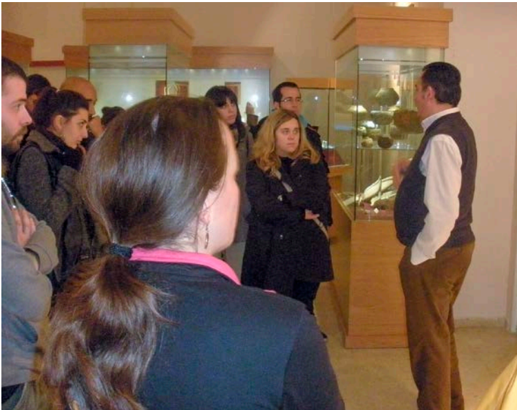
23. Visita al Museo de Valencina de la Concepción