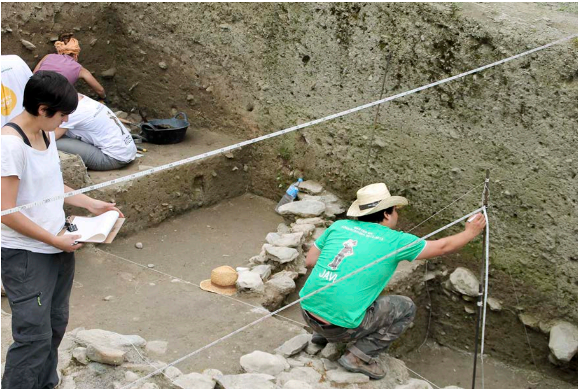
04. Prácticas en el Cerro de la Encina