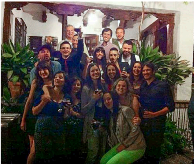
32. Cena fin de máster