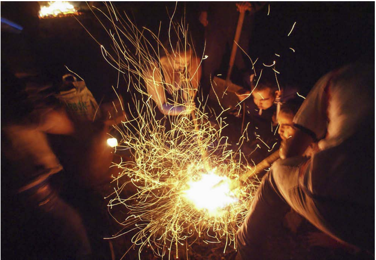
34. Practicas de arqueología experimental en la Algaba (Ronda)