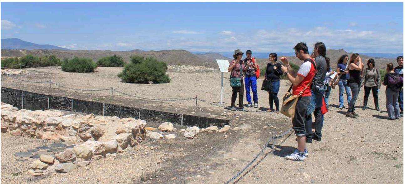
20. Visita a Los Millares