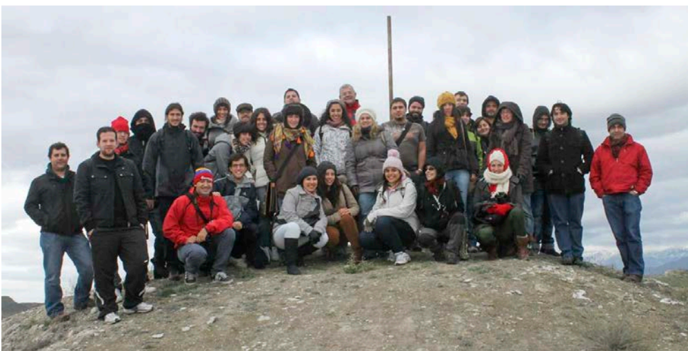
30. Visita a la necrópolis de Tutugi