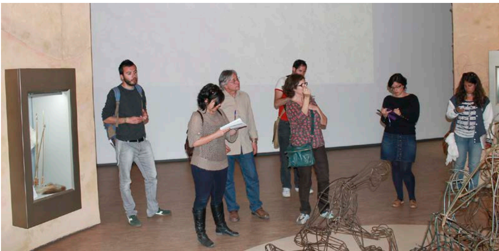
21. Visita al Museo de Almería