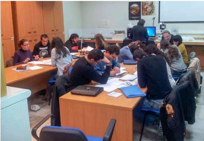
13. Clases de Registro arqueológico