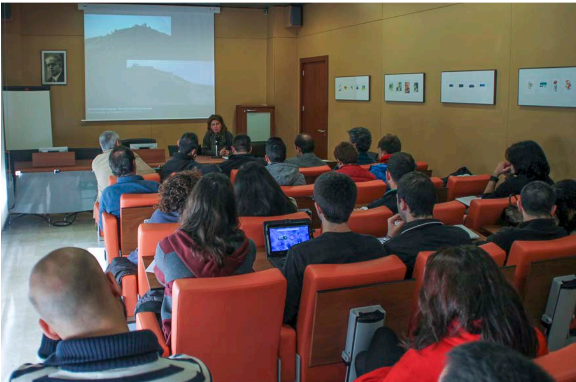
16. Conferencia de Francesca Sogliani