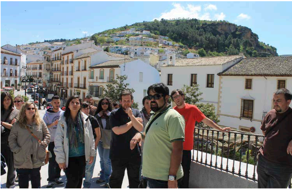
22. Visita a Montefrío