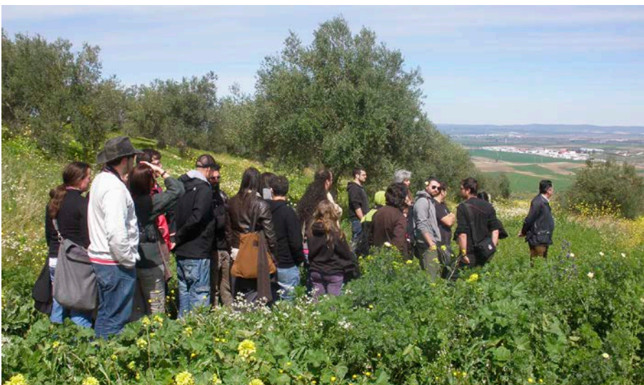
24. Visita a los dólmenes de Valencina de la Concepción