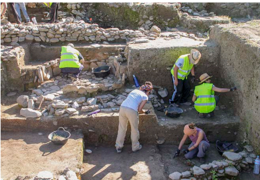
03. Prácticas en el Cerro de la Encina