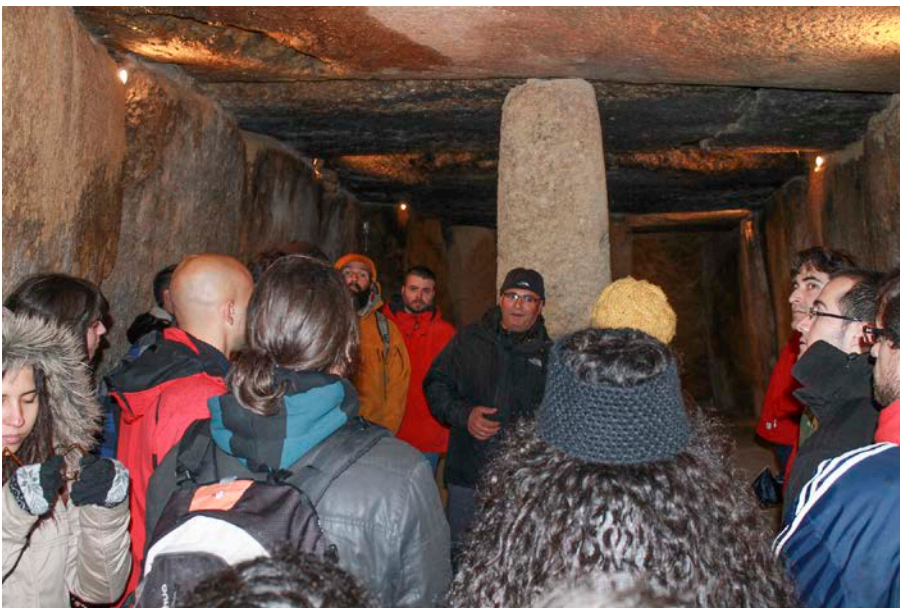
18. Visita a los dólmenes de Antequera