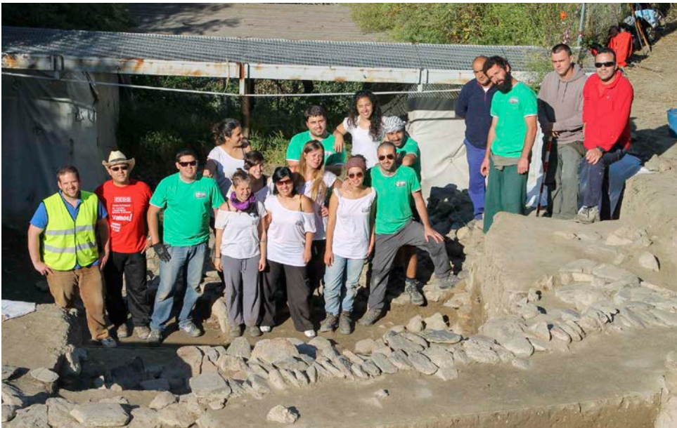
06. Prácticas en el Cerro de la Encina