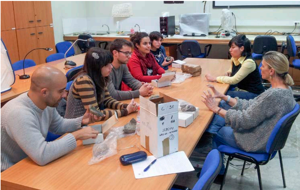
02. Seminario de Arqueometalurgia