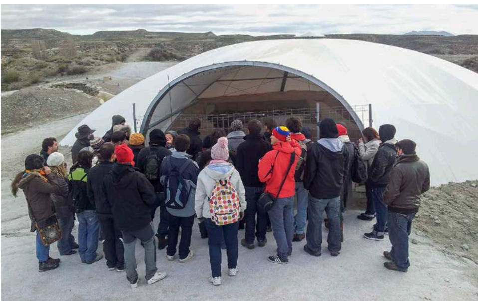
14. Visita a la necrópolis de Tutugi