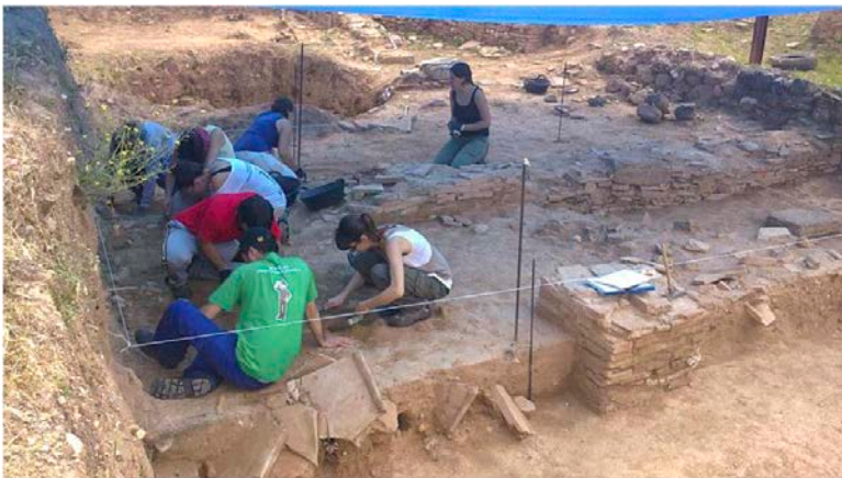
29 Prácticas en los Hornos romanos de Cartuja