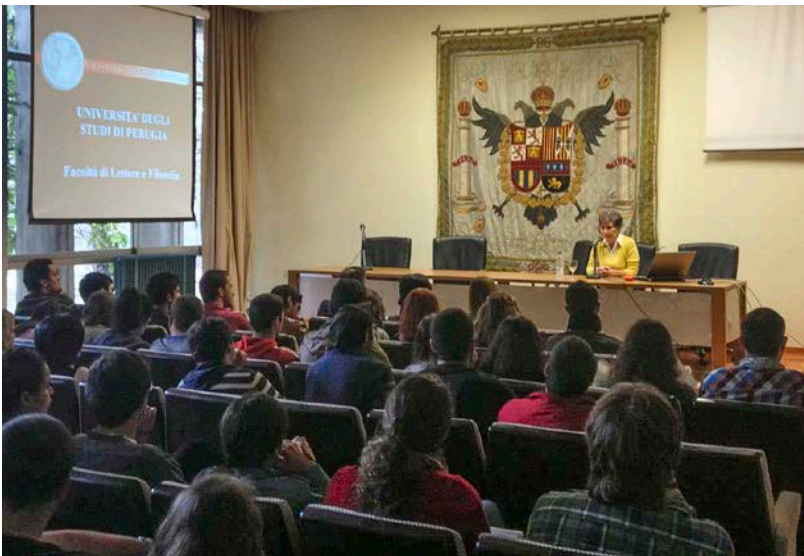
07. Conferencia Margherita Bergamini