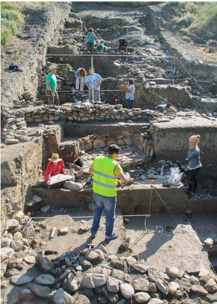
05. Prácticas en el Cerro de la Encina