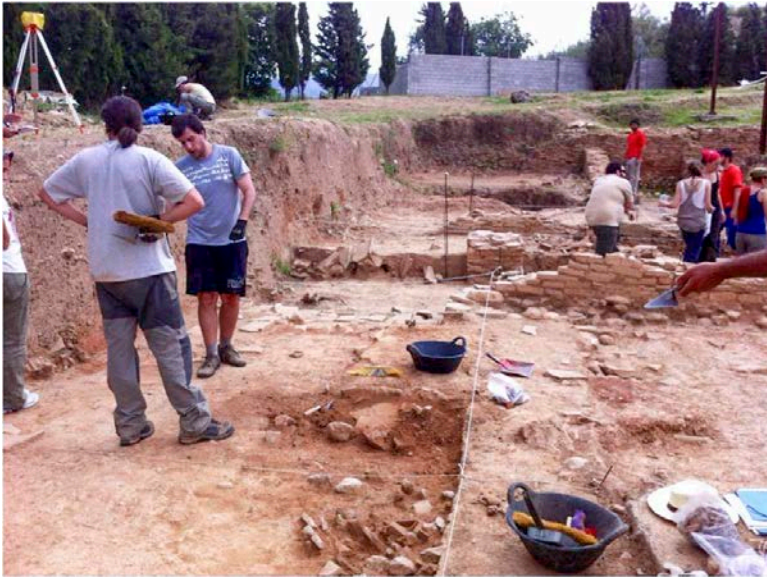
28 Prácticas en los Hornos romanos de Cartuja