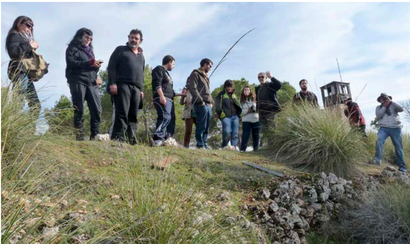
25. Visita a la Mesa de Fornes