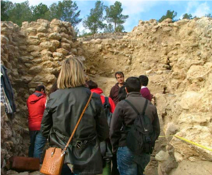
09. Visita a La Bastida de Totana (Murcia)