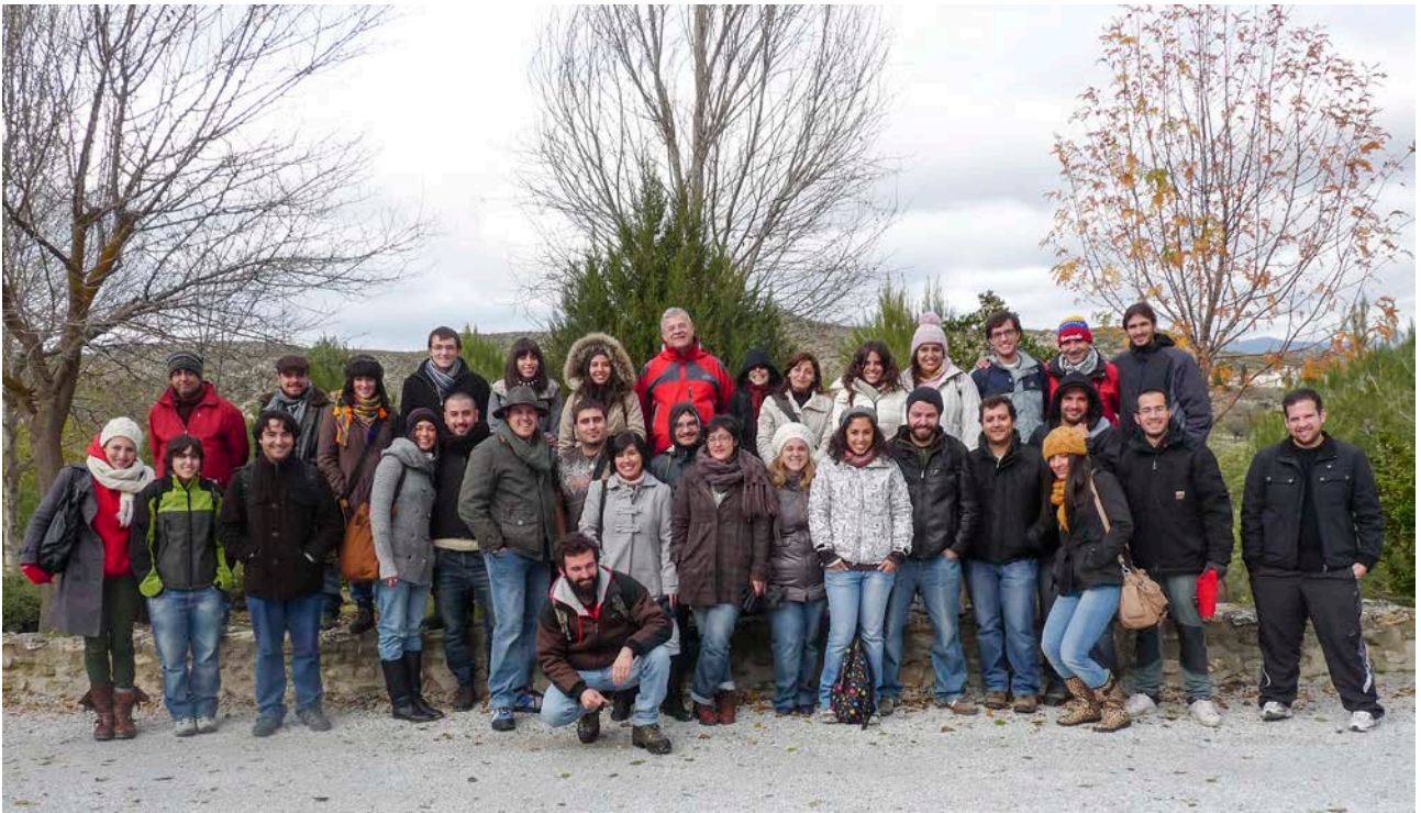
15. Visita al Castellón Alto de Galera