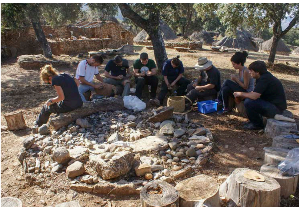
33. Practicas de arqueología experimental en la Algaba (Ronda)