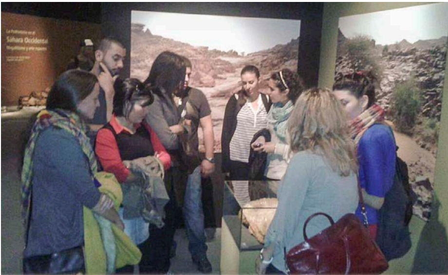
31 Visita al parque de las Ciencias y a la exposición sobre la Prehistoria en el Sahara