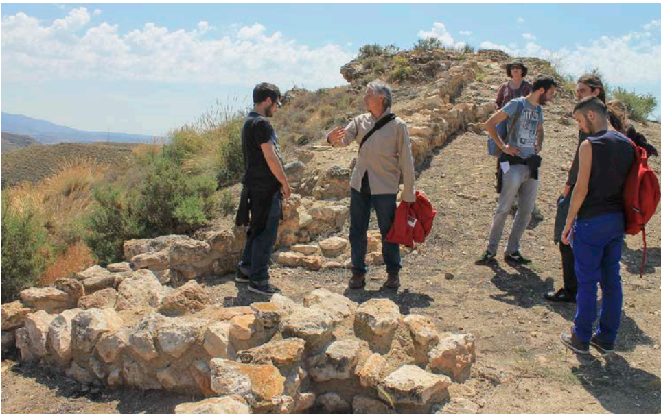
19. Visita a Los Millares