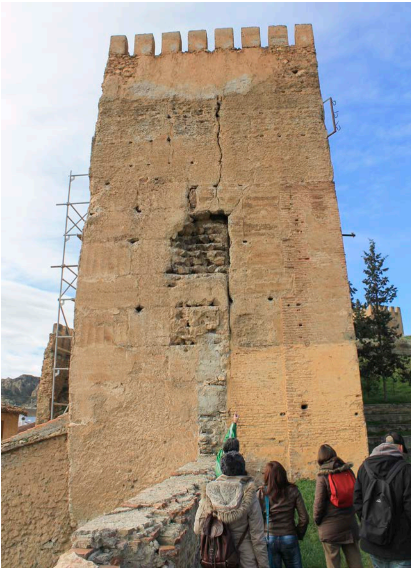
17. Visita a la Alcazaba de Guadix