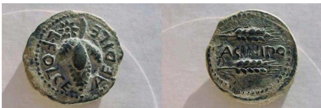
Lam. 3. Anverso y reverso de moneda de bronce de Acinipo. En ella se puede ver la presencia del topónimo de la ciudad, de un edil monetario y del racimo de uvas y las espigas de trigo, tipos frecuentes en la ciudad

Todos estos cambios sociales e institucionales que se documentan a través de la epigrafía y la numismática habrían de culminar con la recepción del estatuto municipal por parte de las comunidades serranas. Este hecho, que supondría el punto culminante de su integración en la estructura estatal romana, tuvo lugar en la mayoría de nuestras ciudades durante la dinastía de los Flavios (MORALES RODRÍGUEZ, 2000).