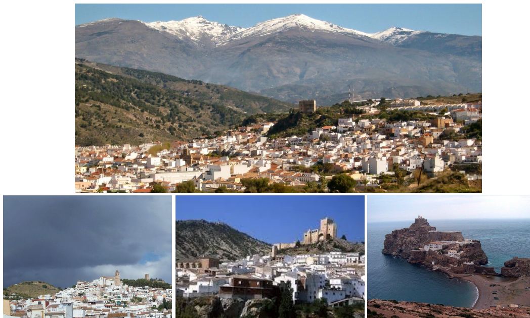
Figure 4: Photographies tirées de leurs pages Wikipédia respectives des quatre Vélez discutés ici: en haut, celui de Benaudalla, en bas de gauche à droite, ceux de Malaga, Vélez Blanco et de la Gomera.

Finalement, certains auteurs 70 ajoutent à cette liste le petit village de montagne de Velefique, près du désert de Tabernas dans la province d'Almeria. Il se trouve qu'il est ancien, cité par ibn Hazm, al-Idrissi, ibn al-Khatib et al-Maqqari entre autres. Il avait hébergé dès le X e siècle des communautés religieuses dissidentes et eut son heure de gloire à la fin du XII e quand il accueillit un célèbre sufi , Ibn al-Hadjadj, et recensa un important Hisn ainsi que quantités d'aljibes et de mosquées, dont l'une compte parmi les rares de l'époque omeyyade encore conservées 71 .