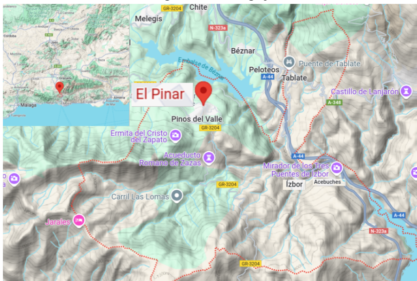
Figure 2: Carte de la municipalité d'El Pinar où l'on peut voir l'emplacement des quatre villages qui la composent: Pinos, Izbor, Acebuches et Tablate. L'insert montre sa situation dans la région.

observer trois ponts, celui en pierre du XIX e siècle et les deux datant de la fin du XX e et du début du XXI e siècle. Mais, il y en a un quatrième: l'ancien pont dit nasride qui était le passage obligé pour le voyageur ou le commerçant venant de Grenade et allant vers la Costa Tropical ou la Alpujarra.