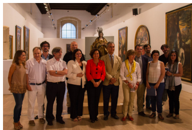
Foto 1 de grupo