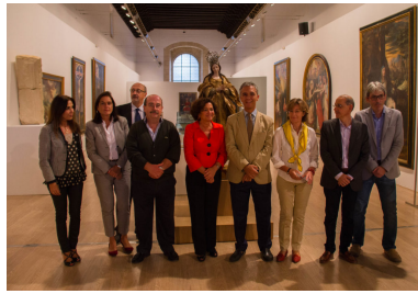
Foto 2 de grupo