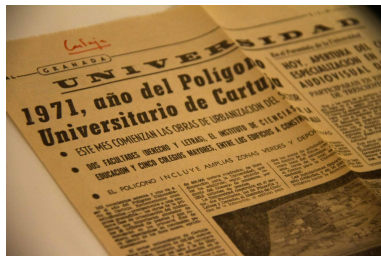
Detalle 2 de la exposición