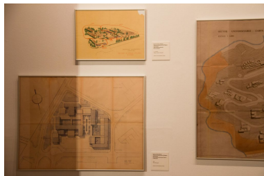
Detalle 4 de la exposición