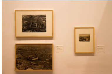
Detalle 1 de la exposición