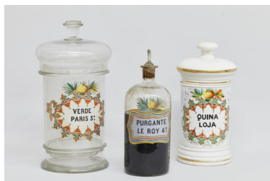
Botamen de la Farmacia Zambrano S. XIX y XX Cristal y Cerámica Universidad de Granada