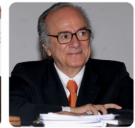
Boaventura de Sousa Santos