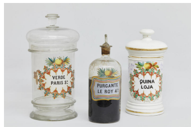
Botamen de la Farmacia Zambrano S. XIX y XX Cristal y Cerámica Universidad de Granada