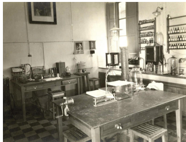
Laboratorio general de las clínicas, en la antigua Facultad de Medicina de la calle López Argüeta, en torno a 1920 (Procedencia: Archivo Universitario, referencia: AUG FOTU03756).