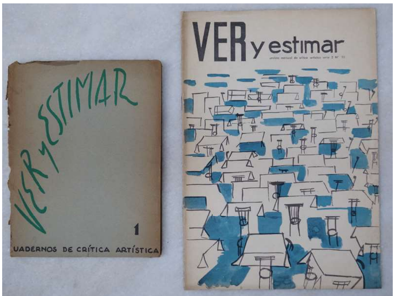
3. Cubiertas de Ver y estimar . Buenos Aires, vol I, nº 1, abril de 1948, y serie 2, nº 10, octubre de 1955. Colección MLR.