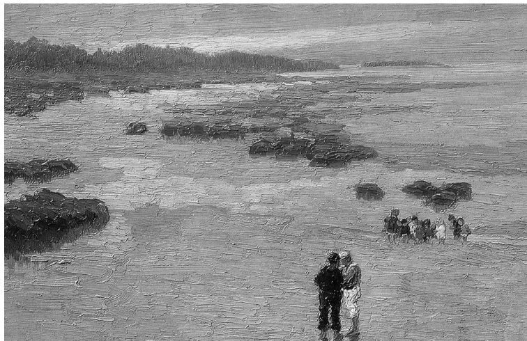
3. Pío Collivadino. Playa Anchorena (1916). Óleo sobre lienzo, 37 x 54 cms. Col. Zurbarán Galería, Argentina.

dolfo Franco, Tito Cittadini —ambos de destacada actuación en años posteriores en España, especialmente en Mallorca— y Américo Panozzi, entre otros, fue de vital importancia en la evolución de las artes plásticas en la Argentina.