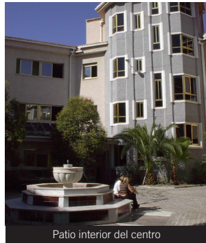
Patio interior del centro