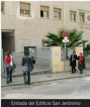
Entrada del Edificio San Jerónimo

Líneas: Acceso al Campus Centro: líneas U, 4, 5 y 6.