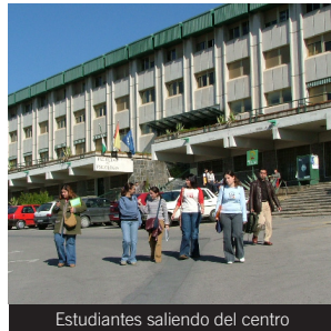
Estudiantes saliendo del centro