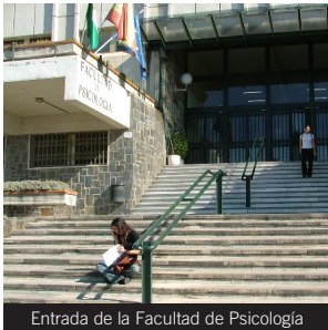
Entrada de la Facultad de Psicología

Líneas: Acceso al Campus de Cartuja: C, U y 8.