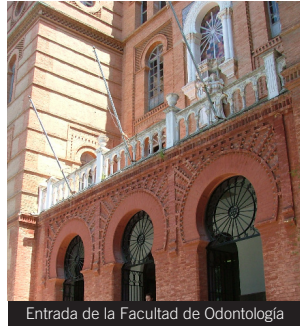
Entrada de la Facultad de Odontología