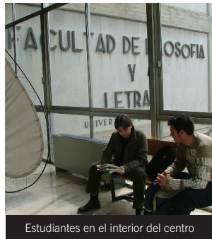
Estudiantes en el interior del centro