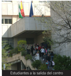
Estudiantes a la salida del centro