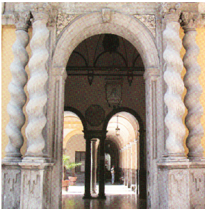
Entrada principal, en la plaza de la Universidad

Líneas: 1, 3, 4, 6, 7, 8, 9, 11, 23, 33 y C (Acceso por Gran Vía), y 5 y U, (por Severo Ochoa)