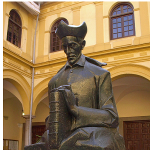
Estatua del Padre Manjón, en el interior