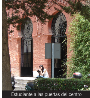
Estudiante a las puertas del centro