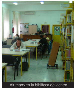
Alumnos en la biblioteca del centro