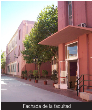
Fachada de la facultad

Líneas: Acceso al Campus Ceuta: Plaza de la Constitución-Barriada del Morro