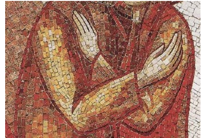
Imagen: San Joaquín y Santa Ana (detalle) . Capilla Redemptoris Mater. Roma. Marko I. Rupnik, S.J.

Queremos profundizar en el misterio de la libertad del hombre, capaz de acoger o rechazar el amor. En su respuesta queda comprometida su afectividad , aunque, en ocasiones, no nos damos cuenta. ¿Qué papel juegan los afectos en esta respuesta del hombre?, ¿qué relación guarda la afectividad con la sexualidad y cómo se ordenan ambas a la luz de la entrega del corazón?