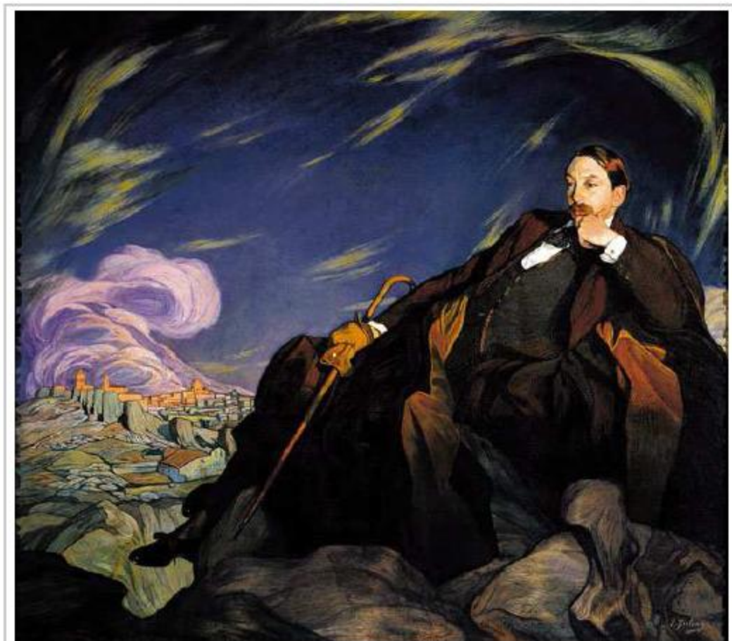
Ignacio Zuloaga. Retrato de Enrique Larreta (1912). Óleo sobre lienzo, 188 x 213 cms. Museo de Arte Español "Enrique Larreta", Buenos Aires. ( Fig. 3 )

El argentino Cesáreo Bernaldo de Quirós y el vasco Ignacio Zuloaga, tras el éxito alcanzado por ambos en la Exposición Internacional del Centenario llevada a cabo en Buenos Aires en 1910, consolidaron su amistad en el París de preguerra, en buena medida gracias a la presencia de íntimos amigos comunes, y en especial al escritor Enrique Larreta, a quien Zuloaga retrataría en 1912 ( Fig. 3 ). Pero en 1914, con el inicio de la contienda, el escenario se volvió turbio, sobre todo para los extranjeros. Zuloaga y Quirós retornan a sus tierras natales: aquél partió para Guipúzcoa y Quirós, quien había expuesto con suceso en la capital francesa hacía pocos meses, luego de tres años de residencia en Buenos Aires, se marchó a Gualeguay.