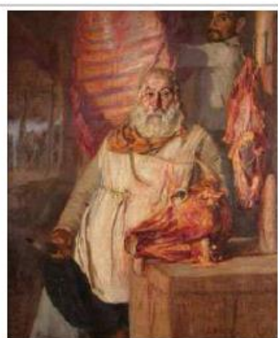
Cesáreo Bernaldo de Quirós. El carnicero (1926) (De la serie Los Gauchos 1850-1970 ). Óleo sobre lienzo, 146 x 120 cms. Museo Nacional de Bellas Artes, Buenos Aires. (Fig. 4)

Cuando Quirós presentó en Buenos Aires, en 1928, los treinta lienzos de la legendaria serie “Los Gauchos 1850-1870” (Fig. 4), público y crítica le situaron en un sitio de privilegio dentro del arte argentino. El escritor Leopoldo Lugones, en ocasión de un homenaje que se rindiera al pintor, declaró: “queremos que los veintitantos cuadros de la obra actual de Quirós queden juntos en el país y lo señalaremos como un gran acto del gobierno... Así lo deseamos para tener algo que mostrar a los extraños... como el núcleo de esta otra riqueza argentina... grande y luminoso amigo, la gloria es tuya, porque supiste ganarla. Sepa la Nación reconocerla conforme a su