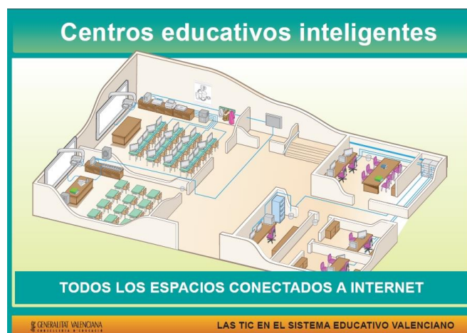
Figura 1. Modelo CEI de la Generalitat Valenciana

Para nosotros es muy importante la figura del servidor de centro, que funcione perfectamente y que ofrezca todo aquello que necesitan los profesores y los alumnos y el resto de puestos, terminales “tontos” o clientes ligeros que se conectan a la red y funcionan con todo tipo de servicio de Internet.