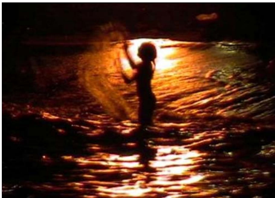
Foto 19. La mágica noche de san Juan es un magnífico ejemplo de los rituales festivos que han conseguido superar incesantes prohibiciones.

La investigación ahora publicada es el resultado final de un estudio comparativo etnohistórico emprendido a lo largo de más de 30 años sobre esa categoría cultural que son los ritos festivos de la entidad geográfico-histórico-política constituida por el estado español, con su eje vertebral en las fiestas granadinas, que se han trabajado exhaustivamente (15). Y uno de los resultados es constatar que "la historia de las fiestas populares ibéricas es la historia de sus prohibiciones". Pero que han conseguido superarlas.