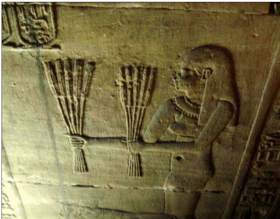
Foto 3. Ofrenda ritual en el templo de Horus en Edfu, siglo III a. C.