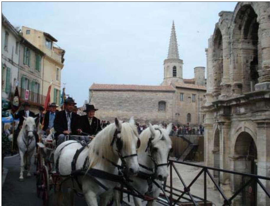
Foto 7. La herencia pagana en los fastos sociales es parte de nuestra cultura actual. En Arlés, el desfile de los Guardas con sus caballos camargueses pasa ante el anfiteatro romano.

Uno de los aspectos de la antropología cultural que más se han desarrollado a fines del siglo XX ha sido el relacionado con las fiestas tradicionales o populares, hasta el punto de que la abundancia de estudios monográficos y generales sobre los diversos universos festivos, se convirtieron en una especie de fenómeno intelectual de moda, que buscaba ampliar nuestro conocimiento sobre la sociedad del presente. Para cumplir con este objetivo, habría que resaltar la dimensión comunicativa y funciones de transmisión cultural y memoria histórica ejercidas por los ritos festivos, que se deben contemplar desde una perspectiva de continuidad temporal en cuanto procesos rituales, sujetos a la evolución de sus formas y significados, actualizando múltiples modelos. Y también destacar la necesidad del estudio global de sus variantes si se los quiere interpretar, aceptando que se les puede aplicar la formulación estructuralista de Lévi-Strauss de ser "piezas de un sistema en el seno del cual se transforman mutuamente" (1985: 79).