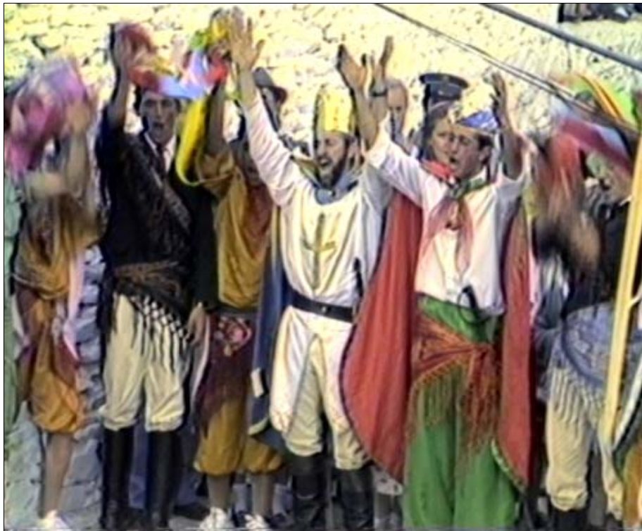
Foto 14. Entre los rituales festivos bélico-religiosos, las funciones de Moros y Cristianos descenden de modelos medievales. En la representación de Trevélez (Granada), al término se unen los victoriosos cristianos con sus vencidos oponentes para vitorear al patrono de la comunidad.

nombrados patronos o protectores y se les rinde especial culto; con los votos públicos se agradece la falta de víctimas de terremotos e incendios; y la milagrosa aparición de una imagen puede haber aportado beneficios a la localidad agraciada. Con un componente más profano se tienen los aniversarios de fundaciones de ciudades, victoriosas batallas o guerras y otros sucesos de trascendencia cívica y social (13) .