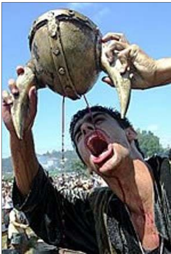
Foto 13. La romería vikinga de Catoira (Pontevedra) representa un nuevo tipo de fiesta lúdica, sin elementos religiosos.

También desde entonces, se aprecia un interés por la religiosidad popular entre los círculos pastorales católicos, quizás como reacción ante los curas tiratapias que expulsaban los santos de los templos, pensando seguir así las directrices del II Concilio Vaticano. Siendo la sociedad cada vez más laica, al mismo tiempo aumentan los fieles organizados. Este fenómeno interesa mucho a los antropólogos, al considerar las cofradías como especialistas del rito de lo sagrado, que configuran un mecanismo de estructuración social: participar en sus actividades puede ser necesario para integrarse en la vida social o pública (11) . Como revelador dato se tiene que en 2003, Andalucía contaba con un total de 1.935 hermandades y cofradías, agrupando a más de medio millón de cofrades, de los que 225.220 se encontraban en Sevilla (12) .