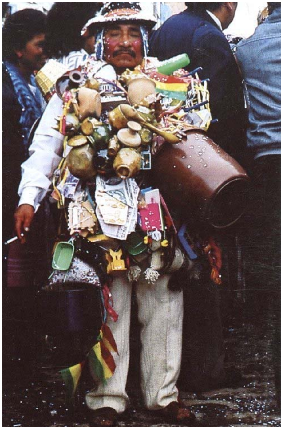
Foto 9. Ekeko, recargada personificación del dios de la abundancia en los Andes.