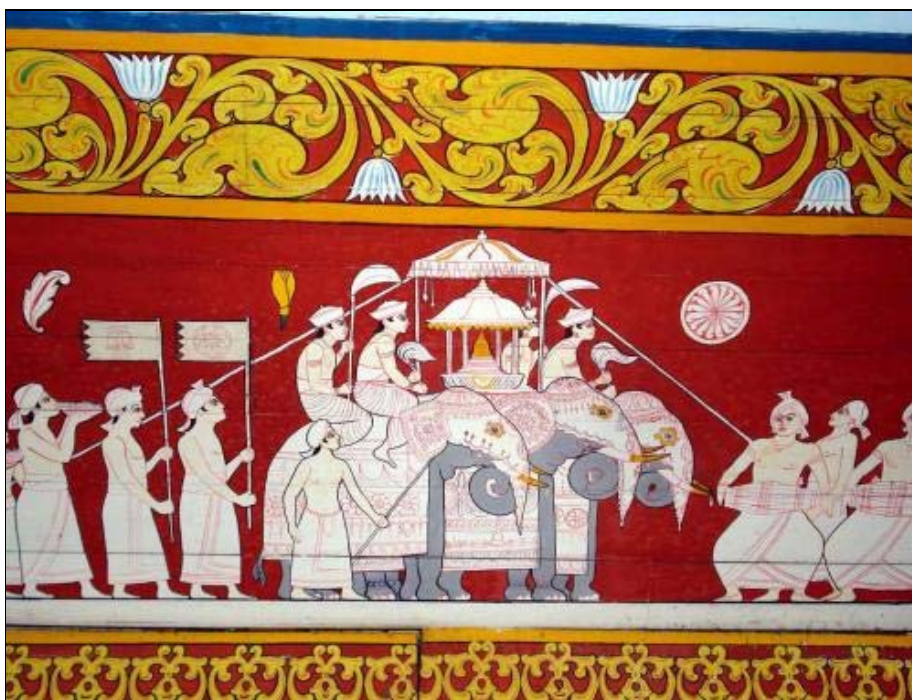
Foto 5. Procesión con el diente de Buda, en la Perahera de Kandy (Sri Lanka).

Es apreciable el cambio de costumbres desde el Siglo de Oro hispánico, cuando en ese precursor diccionario que fue el Tesoro de la lengua castellana de Covarrubias (1611), la voz fiesta se definía: "Del nombre latino festus . Los gentiles tenían sus días de fiesta, en los cuales ofrecían sacrificios a sus vanos dioses o celebraban sus banquetes públicos o juegos, los días de sus nacimientos, y comúnmente decimos, cuando hay regocijos, que se hacen fiestas. La Iglesia Católica llama fiesta la celebridad de las pascuas y domingos y días de los santos que manda guardar, con fin que en ellos nos desocupemos de toda cosa profana y atendamos a lo que es espíritu y religión, acudiendo a los templos y lugares sagrados a oír las misas y los sermones y los oficios divinos y en algunas de ellas a recibir el Santísimo Sacramento y vacar a la oración y contemplación. Y si en estos días, después que se hubiere cumplido con lo que nos manda la santa madre Iglesia, sobrare algún rato de recreación, sea honesta y ejemplar."