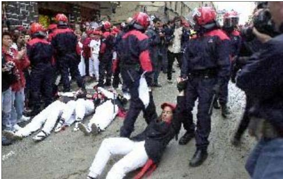
Foto 12. Pero hay esferas que aún no admiten la participación plena de las mujeres, como algunas cofradías y soldadescas. Así, en el alarde de san Marcial de Irún (que rememora la victoria de la milicia foral en 1522 contra los franceses) sólo se les permite intervenir en el desfile festivo oficial como cantineras, produciéndose conflictos durante años con las mujeres que reclamaban su derecho a salir de soldados, como se aprecia en la foto de su expulsión del desfile en 2002. A partir de 2005 se realizan dos desfiles separados: el tradicional y el mixto, del que en 2008 por primera vez fue una mujer su comandante.