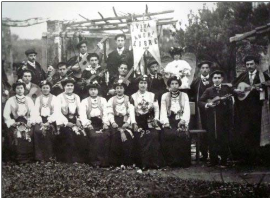
Foto 16. Comparsa de carnaval alabando en 1905 al "amor libre" entre los pescadores de Pontedeume (La Coruña).

A las fiestas podemos aproximarnos desde diversas vertientes, y una de las más novedosas resulta ser la sociológico-política, al considerar los rituales públicos como forma institucionalizada de la acción simbólica, que cumplen el arriba mencionado rol en los procesos sociopolíticos, ya que sus elementos significativos no quedan al margen de la realidad social; más bien, el sentido de los símbolos "guarda relación con lo que ese símbolo hace y con lo que con él se hace, por quiénes y para quiénes", tal como expresa Turner (1980: 1), interesado por desvelar el discurso de la auto-reflexión comunitaria que percibe en los rituales entendidos como sistema en evolución .