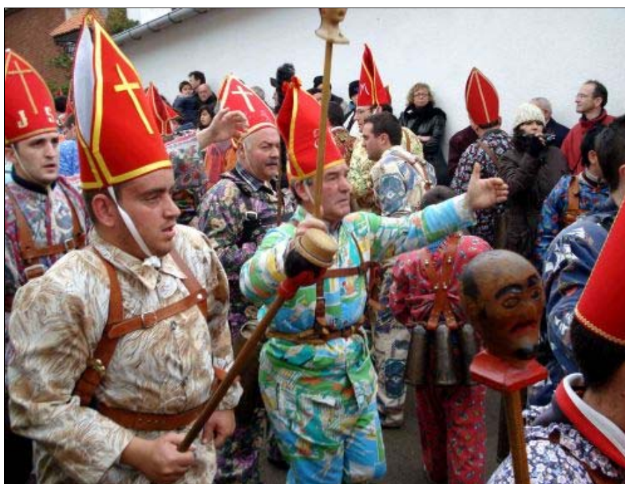
Foto 1. Abundan los festejos tradicionales y populares con elementos enigmáticos, muy complicados de interpretar, como la Endiablada en honor de san Blas en Almonacid del Marquesado (Cuenca).

Según el buscador Google, el 1º de enero de 2009 el término castellano fiesta aparecía en Internet en casi 89.000.000 páginas. Es innegable la relevancia de las actividades festivas para estructurar y modelar nuestra vida social, de la que son una de sus señas de identidad. Este mes de mayo publico un libro con historias de las fiestas más significativas en la cultura ibérica, documentadas desde una posición antropológica, del que a continuación se presenta el capítulo inicial, que indica la orientación teórica seguida.