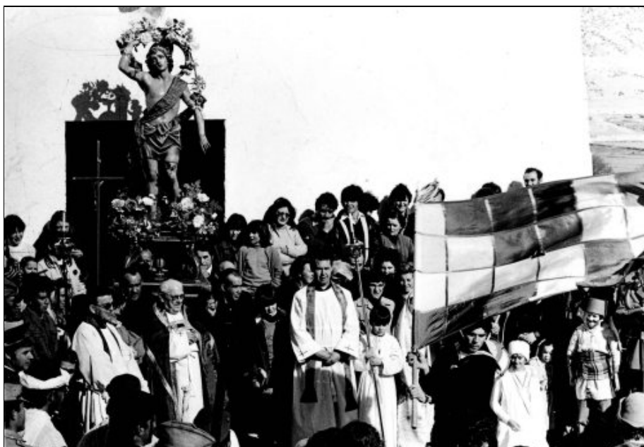
Foto 15. Homenaje con la bandera a san Sebastián, patrono de Orce (Granada), en su fiesta del 20 enero de 1981.

Antes de concluir con este marco teórico, bueno será considerar lo que Manning señala como temas que nos guiarán en el estudio de las celebraciones: "Su paradójica ambigüedad, su significado como texto socio-cultural, su rol en los procesos sociopolíticos y sus complejas relaciones respecto a la modernidad y la jerarquía. Estos temas constituyen un centro conceptual desde el que irradian nuestros estudios comparativos culturales" (1983: 7). A lo que se puede añadir su crucial papel en el mantenimiento de los vínculos sociales ya establecidos.