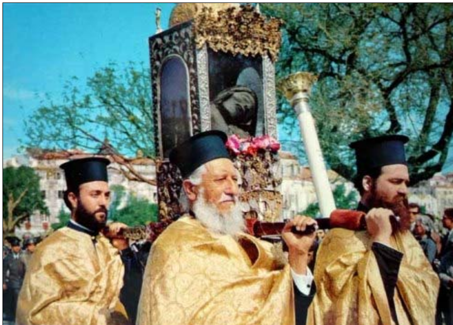
Foto 4. Procesión con el cráneo de san Spiridon en Corfú (Grecia).