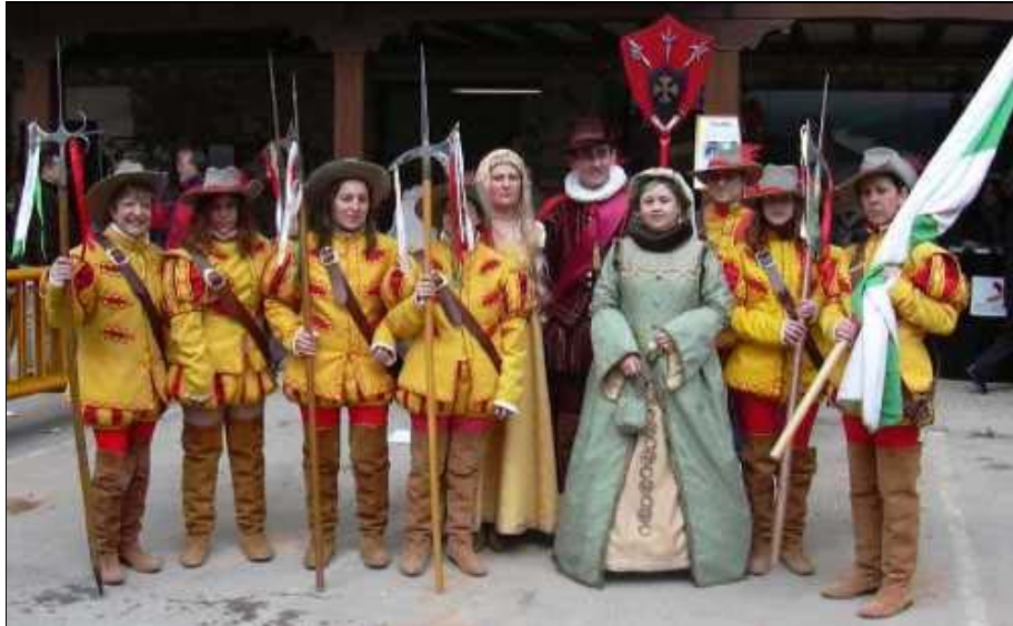
Foto 11. Una reciente transformación festiva es la incorporación de las mujeres en roles activos y de organización. Una muestra es la Asociación de Mujeres "Encarnación Díaz de Yela", fundada en 2002 en Tendilla (Guadalajara), y que dinamizan festejos como la Feria Medieval.

Desde la muerte del caudillo-dictador Franco en 1975, se constatan amplias modificaciones en los rituales festivos. Muchas tradiciones están desapareciendo, y si no se las estudia pronto, puede que ya no sea posible. Otras, ocupan su lugar.