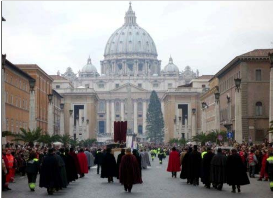
Foto 6. La Iglesia católica mantiene arcaicos rituales festivos, como esta comitiva que acompaña a la bruja Befana el 6 de enero a visitar al papa.