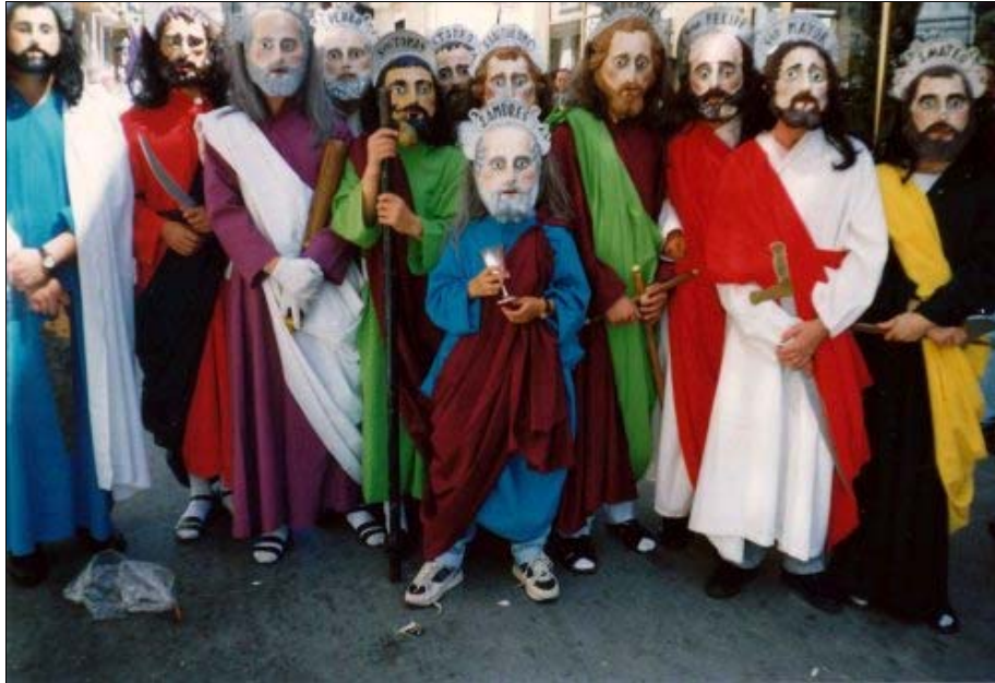
Foto 17. "Foto de familia" del Apostolado que procesiona en la Semana Santa de la cordobesa Cabra.

Avisa Agustín García Calvo (14) que el Poder utiliza la Fiesta para comunicarse con la sociedad, por lo que más bien habría que hablar de unas fiestas del Estado seudo-libres. A este respecto, es cierto el continuo control festivo ejercido por los poderes fácticos, y su habilidad para ilusionar con espectáculos que desvíen la atención de los problemas sociales. Pero, si se percibe la fiesta como lugar de un combate simbólico entre el orden y el caos, el poder establecido y la creatividad colectiva, el placer y el trabajo, ¿qué bando goza de más simpatías?