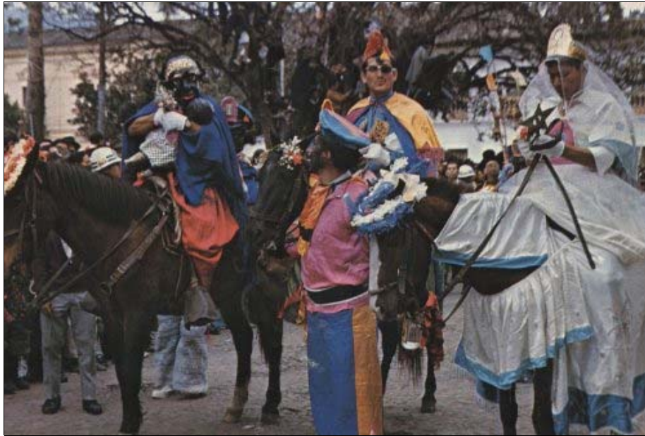
Foto 8. Comitiva de la "Santísima Tragedia" o fiesta de la Mama Negra (la cocinera de la Virgen), con su bebé, el capitán y el ángel de la estrella, en Latacunga, Ecuador.

contaminaciones causadas por las transferencias y transformaciones del material festivo, así como por las diversas procedencias de las influencias modificadoras en las diferentes épocas, que se han ido acumulando y mezclando como por estratos geológicos.