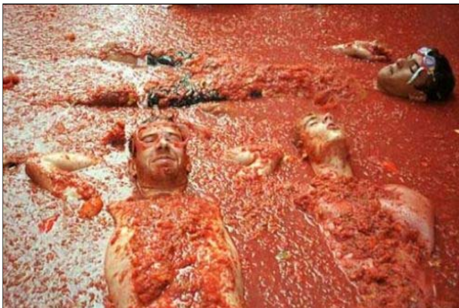
Foto 18. La Tomatina, lúdica batalla de tomates en la que participan miles de personas, ha convertido a Buñol (Valencia) en un referente mundial de festejos singulares.