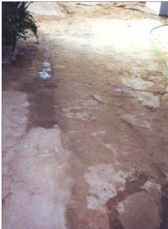
4. Suelo de tierra. Partido de Río Cuevas. Familia González.

1. El empedrado. Su uso no es sistemático en todos los casos, siendo la tierra apisonada ( ilustración 4 ) la técnica y los materiales empleados para la configuración del suelo. El uso de la piedra es frecuente en ranchos con propietarios de gran nivel económico, y en los molinos, eminentemente harineros.