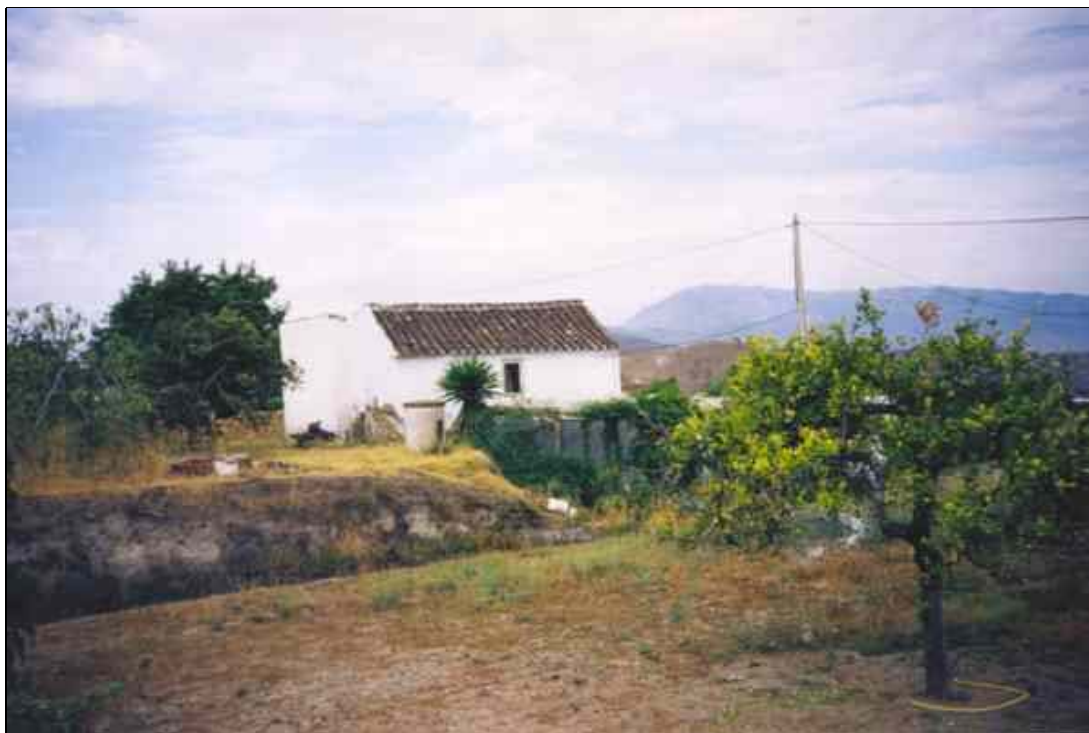
3. Rancho de regadío. Partido de los Llanos.