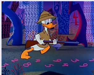
Figura: Donald en el país de las matemáticas (H. Luske, 1959)