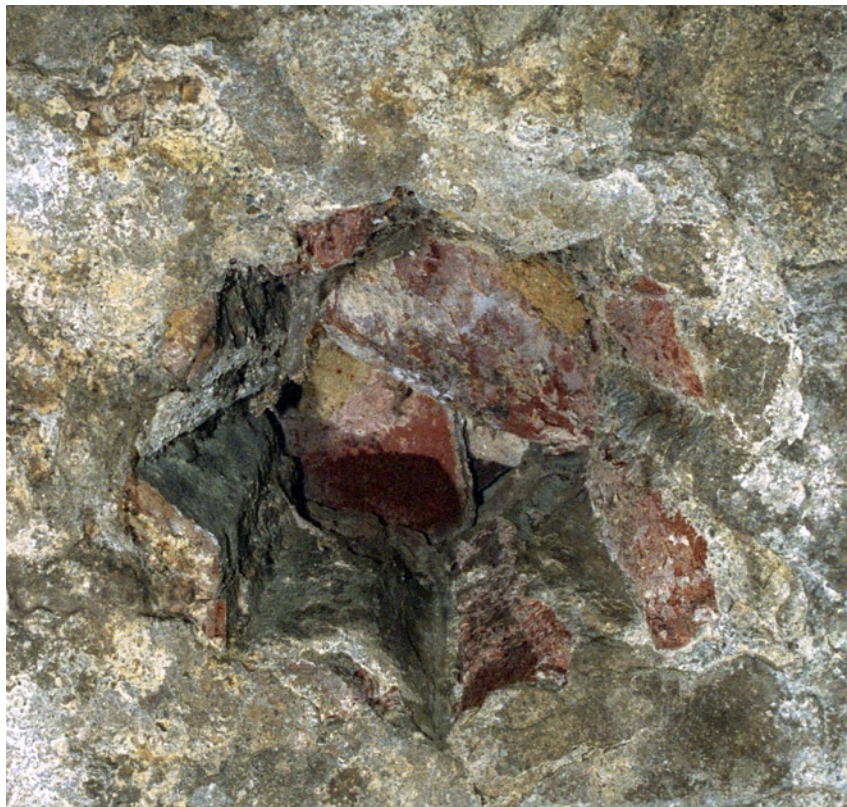
Detalle de lumbrera.

Junto a estos baños se localiza la Acequia de Arabuleila, que tiene su origen en el Genil a su paso por el Puente Verde, en Granada. En el tramo de la acequia que transcurre por Churriana de la Vega se localiza un puente de cantería, hoy soterrado al igual que la acequia.