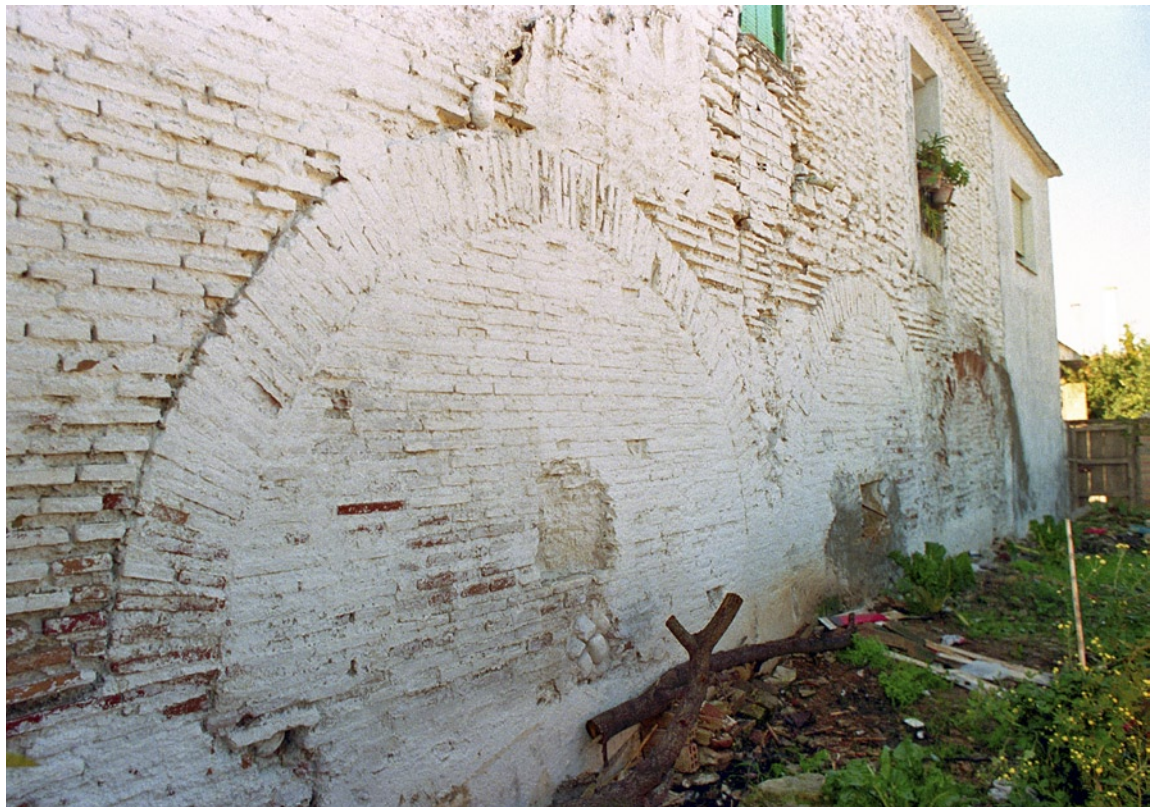
Vista de las naves desde el exterior.