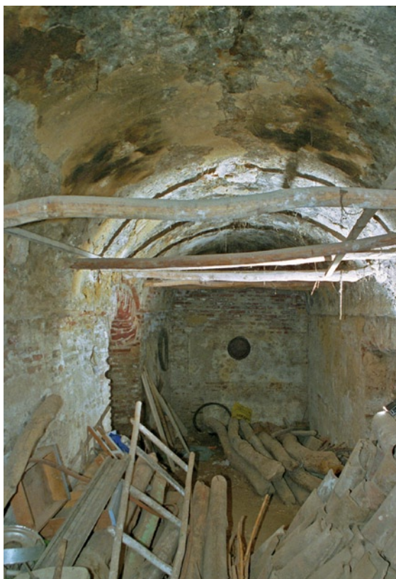
Interior de una de las salas, en la actualidad utilizada como almacén.

III. La Dirección General de Bellas Artes de la Consejería de Cultura de la Junta de Andalucía, mediante Resolución de 4 de diciembre de 1985 (publicada en el BOE número 47, de 24 de febrero de 1987 y BOJA número 124, de 28 de diciembre de 1985) incoó expediente de declaración de Bien de Interés Cultural, con la categoría de Monumento, a favor de los Baños Árabes de Churriana de la Vega (Granada), siguiendo la