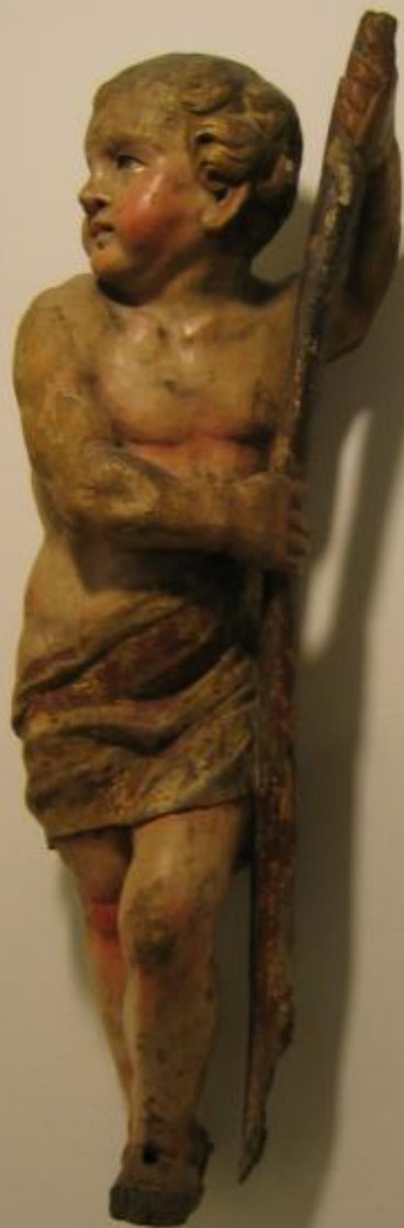
Putto con bastone 1700-1750 Museo di San Matteo Piacenza