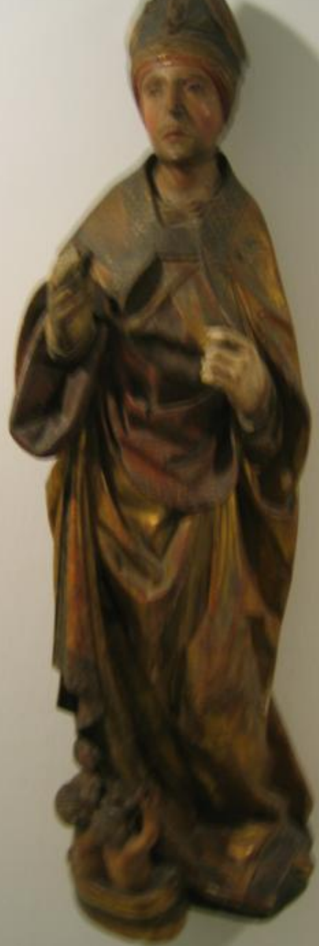
St. John the Evangelist 15th century Wood