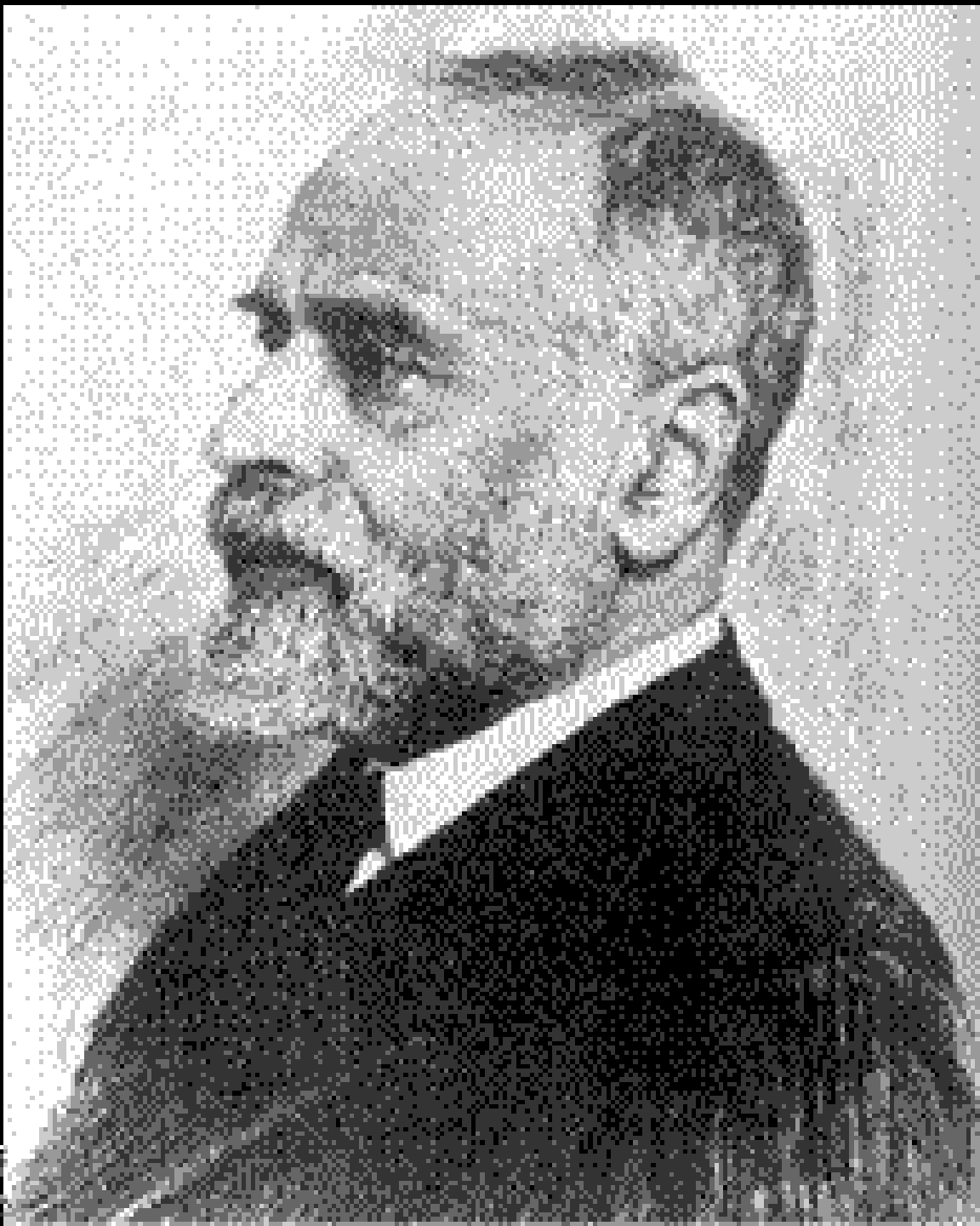
Retrato de Gómez-Moreno