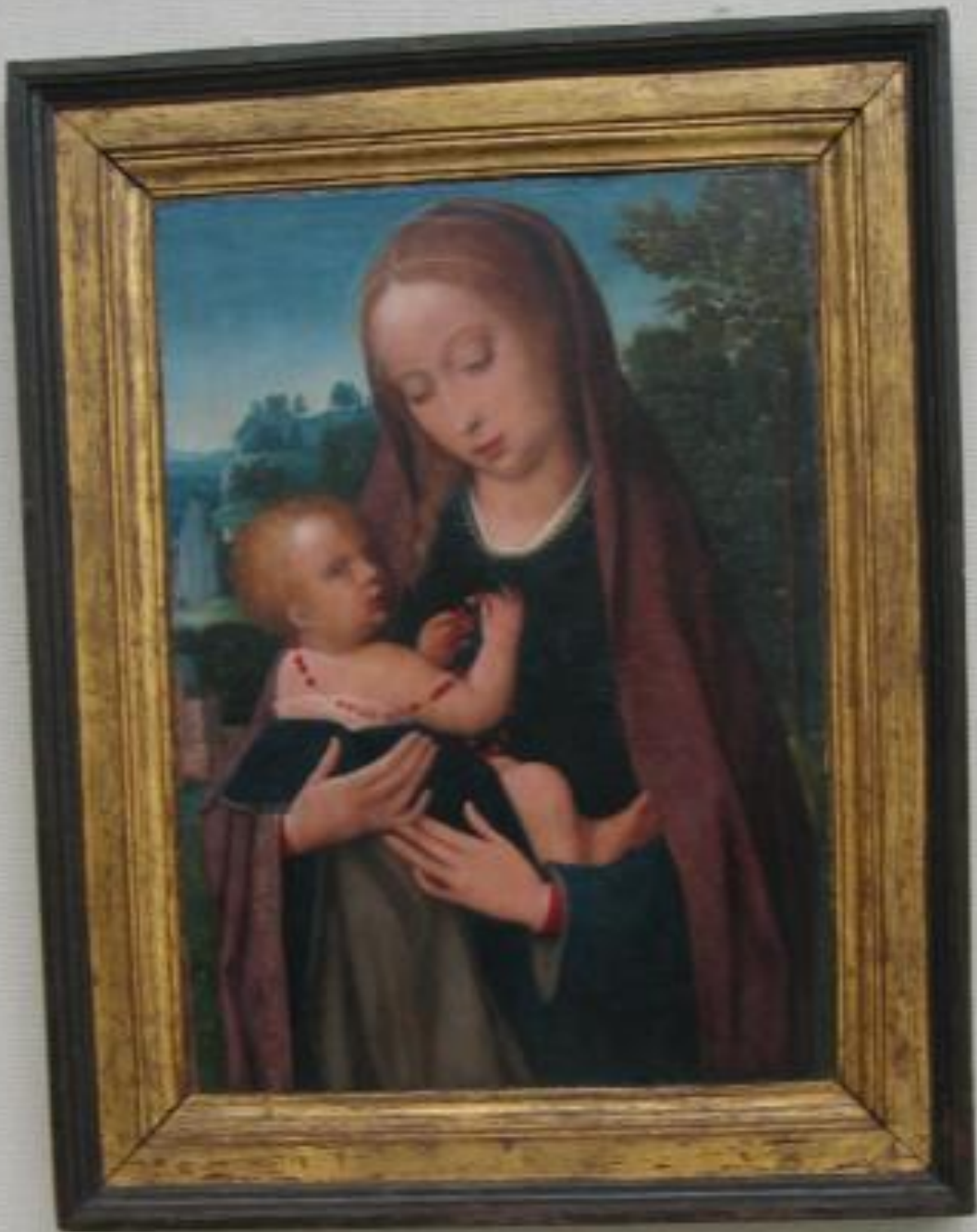
1490 Madonna Lattante (Madonna Allattante) Raffaello, 1490 Museo di Brera