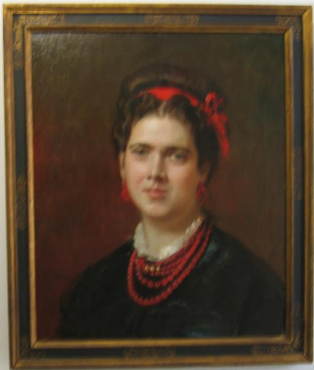
Portrait of a woman in a black dress and red jewelry. 1850-1855 Oil on canvas 18 x 14 inches Inventory No. 1234