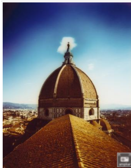
Cúpula de la catedral de Santa María del Fiore de Florencia, obra de Brunelleschi, del siglo XV.

En la sala del Ayuntamiento de Florencia también se enseñaron anoche las maquetas de las tres grúas utilizadas para edificar la cúpula y la del barco inventado por Brunelleschi para llevar el material desde el mar hasta la ciudad, sobre el río Arno. "Esta embarcación es otro ejemplo de su genio", cerró Ricci. "Es el primer ejemplo en la historia de un barco que funciona con una hélice, igual que hacen los aviones hoy. Y es el primer caso de derechos de autor: Brunelleschi la construyó por si solo y poniendo el dinero de su propio bolsillo. En cambio, obtuvo por el Palazzo Vecchio el permiso de alquilarla y exigió que se quemara cualquier intento de imitación". Menudo personaje, el Brunelleschi.