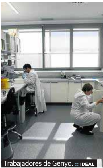
Trabajadores de Genyo.