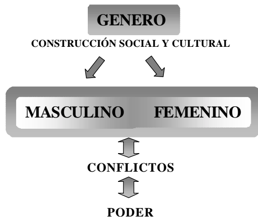
Fig. 8. Definición de Género

proceso histórico-social. Es la categoría que mejor explica las relaciones entre hombres y mujeres. El género es un concepto que empieza a ser utilizado en la década de los años setenta del siglo XX, cuando algunas investigadoras plantean la necesidad de crear un marco teórico para las mujeres del mismo modo que se había hecho con otras categorías como la clase social o la raza: había que utilizar la categoría de género y tratar las relaciones entre los sexos como uno de los conceptos fundamentales para interpretar el proceso histórico-social. [V. Fig. 8]