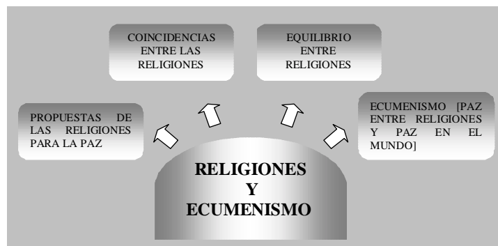
Fig. 12. Ecumenismo

Como hemos visto, las experiencias religiosas pueden presentarse como una experiencia interna, manifestada en múltiples formas como son la espiritualidad, el misticismo, etc., o como una experiencia externa que se manifestaría en los dogmas o creencias, y en la organización de la comunidad. En este último caso se da una clara proyección social y cultural, que, con sus especificidades propias, se manifiesta tanto en las tradiciones religioso/culturales de Oriente como en las de Occidente.