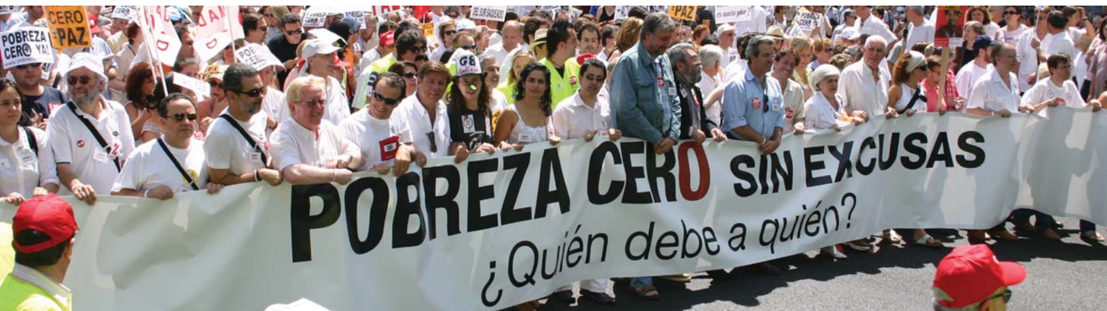
© Juan Vicedo / Intermón Oxfam

Cada campaña nacional se integra en este llamado mundial con su propia identidad, lema y desarrollo.