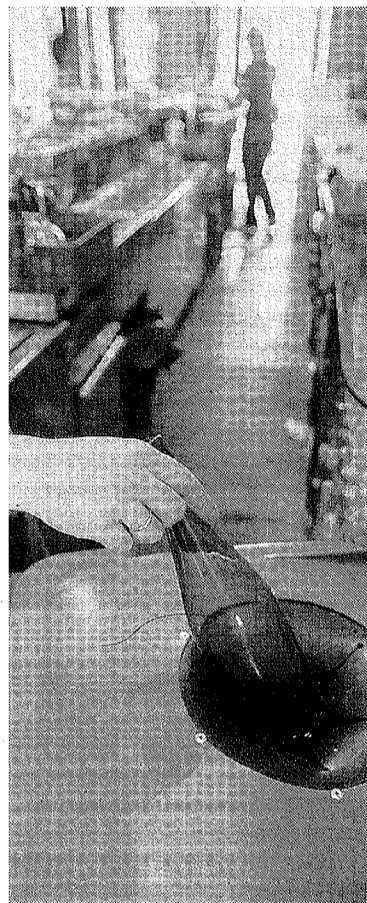
Contenedor de vidrio. :: IDEAL

Andalucía es la segunda comunidad autónoma con mayor número de contenedores. Con los 630 nuevos iglúes instalados el pasado año, Andalucía cuenta ya con 24.876 puntos para depositar sus residuos de envases de vidrio, lo que significa que posee un índice de contenerización de un iglú por cada 337 ciudadanos, mejorando el ratio de 2009