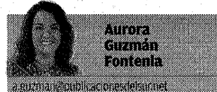
Aurora Guzmán Fontenla

CURSO Los alumnos participan en el proyecto de detección y estímulo del talento matemático 'Estalmat' y son ejemplo de esfuerzo y responsabilidad