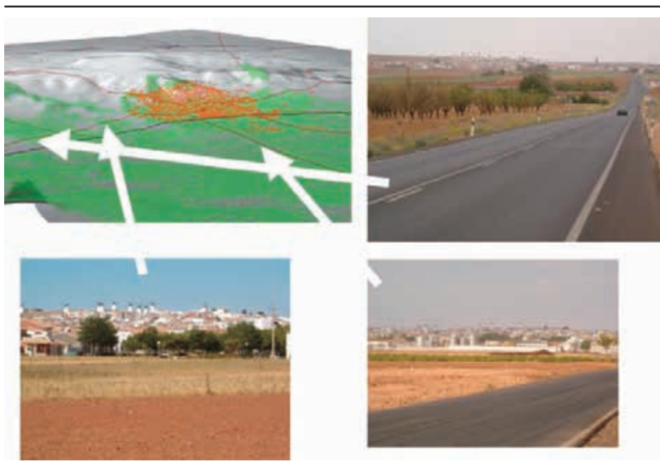
Figura 2. La configuración visual del paisaje y las carreteras de acceso

Convención de Florencia—. A partir de tales percepciones, el paisaje material está en la base de imágenes culturales y de representaciones estéticas que son indisolubles de las formas y de los filtros interpretativos propios de cada época y de cada cultura.