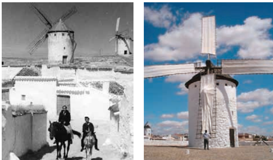
Figura 3. Barrio del Albaicín y molinos históricos. Situación en los años 60 (izquierda). Molino sardinero en el cerro de la paz. 2005 (derecha)