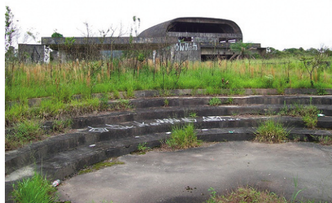
Figura 14. Parque Do Pedroso en Sao Paulo, Brasil