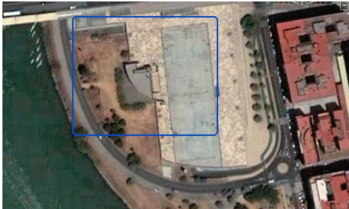
Figura 13. Vista aérea del conjunto