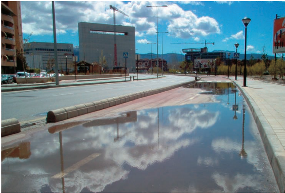
Figuras 1 y 2. Ciclopista en la ciudad de Granada, España