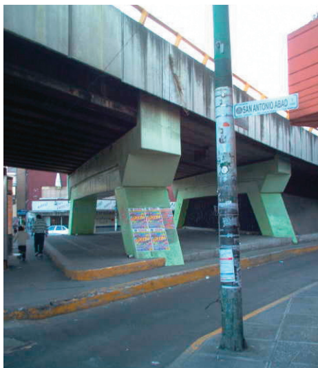
Figura 10. Puente vehicular en Av. San Antonio Abad, México DF

De manera específica utilizo el termino «disfraz» porque frecuentemente las autoridades gubernamentales resuelven a su entender este tipo de fragmentos residuales mediante la siembra de distintos tipos de vegetación basándose y escudándose en el argumento de que son «pulmones» para la ciudad. Sin embargo esto último es una falacia ya que según Jane Jacobs es la circulación de masa de aire la que en realidad realiza la función que impide que las ciudades se sofoquen.