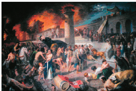
Figuras 17 y 18. Imágenes del incendio de Roma en el año 64 d.c.

Los rumores hacia Nerón fueron estimulados por el conocimiento, o la sospecha, de que el se alegró de que quedara mucho terreno despejado, puesto que deseaba construir un nuevo palacio. (...) Los edificios que escogió para que se reconstruyeran primero fue una mezcla juiciosa de santuarios religiosos y recreación pública. (...) Gran numero de casas particulares habían sido también destruidas, y el emperador estaba preparado con un ambicioso proyecto de urbanización. (GRANT M., 1975, pág. 152 y 163)