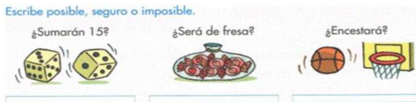
Figura 2. Reconocimiento de tipos de sucesos ([T1], p. 188)

PRI3. Reconocer tipos de sucesos (posibles, imposibles, seguros). Los textos analizados plantean este procedimiento con dos clases de situación didáctica: presentan a la vez varios sucesos, cada uno ligado a un experimento diferente (como en la Figura 2), o presentan un experimento y definen varios sucesos referidos a éste (como en la Figura 3).