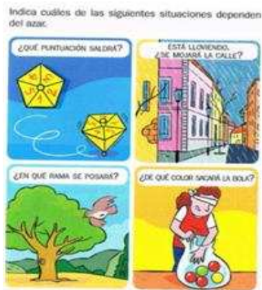
Figura 1. Distinción de fenómenos aleatorios y deterministas ([T3], p. 205)

de la variabilidad en los resultados y de la propiedad de impredecibilidad; por ejemplo al niño de primer ciclo se presenta una ruleta hexagonal de seis colores y se pregunta “Antes de girar la ruleta, ¿podemos saber qué color saldrá? __ Sí __ No” ([T6], p. 165).