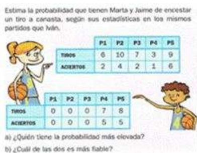
Figura 10. Reflexión sobre la fiabilidad de una estimación de probabilidad ([T5], p. 210)

PRF8. Reflexionar sobre la fiabilidad. Los textos sólo hacen mención a la fiabilidad en dos ocasiones, cuando se enuncia la propiedad y en la actividad de la Figura 10.