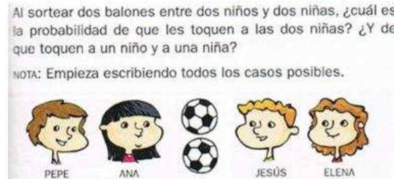
Figura 6. Asignación de probabilidad conjunta en experimentos dependientes ([T5], p. 209)

PRC9. Asignar probabilidad conjunta en un experimento compuesto de dos etapas dependientes. El análisis de experimentos compuestos de dos etapas dependientes constituye un avance importante en el desarrollo del razonamiento probabilístico del niño, pues requiere, por ejemplo, que el niño reconozca la intersección de sucesos, la importancia que puede tener el orden y la dependencia (sin conocer aún la probabilidad condicional). Hay muy pocas situaciones didácticas de este tipo; un ejemplo se observa en la Figura 6.