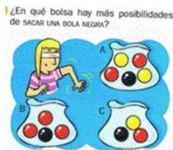
Figura 5. Comparación de probabilidades con razonamiento proporcional ([T3], p. 213)

PRC6. Aplicar la regla de Laplace en experimentos simples. La Serie 1 introduce la asignación numérica de probabilidades con el significado clásico en segundo ciclo y la Serie 2 en tercero. Este procedimiento es muy frecuente en esta muestra de textos, que presentan la forma de cálculo sin mención a sucesos elementales o compuestos, los cuales tampoco se definen, como es de esperar para la edad de los niños: