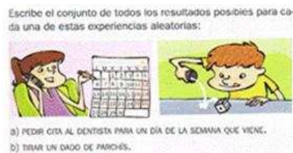
Figura 4. Enumeración del espacio muestral ([T5], p.205)

PRC2. Enumerar o contar casos favorables y posibles. En los textos analizados identificamos dos niveles para este procedimiento, de acuerdo con la complejidad del experimento. El primer nivel trata de enumeración en experimentos simples, donde se pide la lista de posibles resultados sin una técnica, como en la Figura 4.