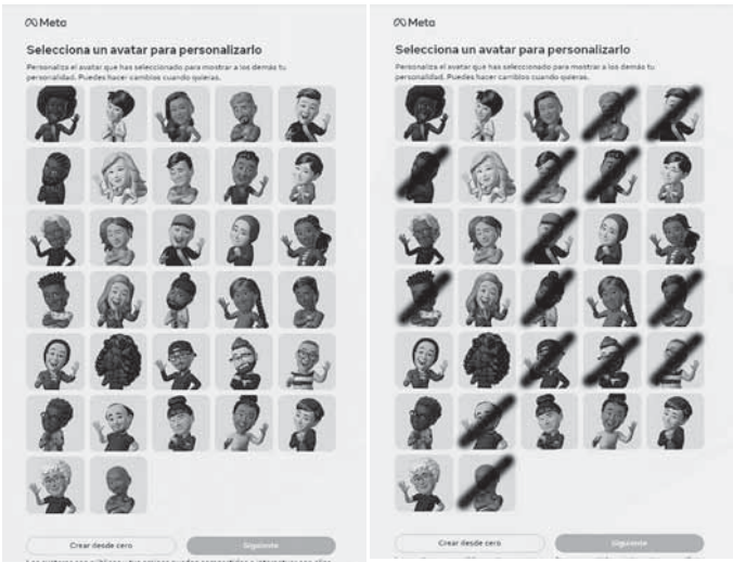
Figura 2. Captura de pantalla de los modelos de avatar en Facebook

Una vez que se solicita crear un avatar, Facebook actualmente ofrece 32 modelos, lo cual supone solamente 32 estéticas e identidades diferentes. De todos estos modelos, tras un análisis iconográfico centrado en las características estéticas que identifican a los géneros tradicionales, se identificaron 14 modelos masculinos ya que poseen atributos socioculturalmente masculinos, como por ejemplo barba, 13 modelos femeninos, y cinco avatares que podrían ser tanto femeninos como masculinos. Por lo tanto, se constituye la muestra de estudio con los avatares identificados como femeninos más los avatares que no se pueden identificar claramente con uno de los dos géneros tradicionales, es decir si son femeninos o masculinos, lo cual permitiría una catalogación mucho más amplia en la cual se incrementaría el número de géneros. Evitando el género como una estructura de poder que naturaliza el binarismo, “la desigualdad sexual adopta la forma de género; moviéndose como una relación entre personas, adopta la forma de sexualidad. El género emerge como la forma rígida de la sexualización de la desigualdad entre el hombre y la mujer” (Butler, 1990, p. 14).