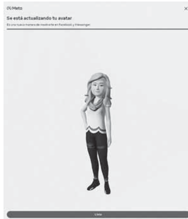
Figura 4. Captura de pantalla de un ejemplo de avatar de Facebook

La delgadez es igual para todos los ejemplos de avatares, no existe dentro de los avatares prediseñados ninguna avatar con un cuerpo diferente, todas presentan el mismo cuerpo, asociado con la delgadez, una persona que no posee dicho cuerpo quizás no se sienta identificada con este tipo de avatar, se trataría entonces de un avatar impuesto que indica cómo debe ser el cuerpo femenino. No destacan características estéticas del cuerpo femenino como caderas o pecho. El concepto de cuerpo es esencial como constituyente identitario.