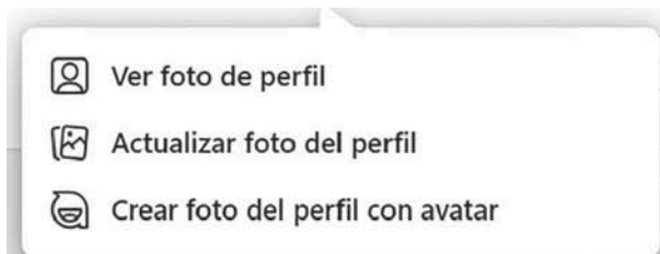
Figura 1. Captura de pantalla de creación de avatar en Facebook

La imagen generada identificará al usuario en Facebook y Messenger. Junto con la creación de la imagen de portada que permite integrar el avatar en un espacio irreal y ficticio, en un espacio virtual (figura 3).