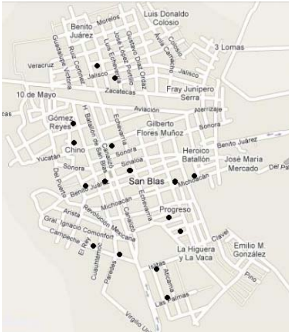
Figura 2. Sitios monitoreados en San Blas, Nayarit, 2004.