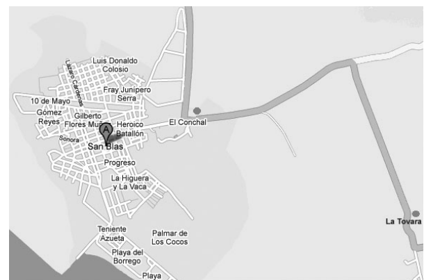
Figura 1. Ubicación de fuente de abastecimiento (La Tovar), caseta de cloración (El Conchal) y localidad de San Blas, 2004.